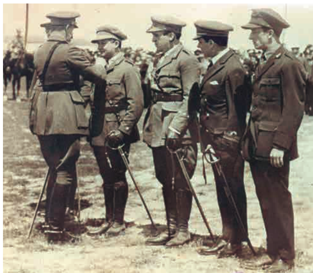
Acto de imposición, por S.M. el rey Don Alfonso XIII de la medalla de oro «Plus Ultra» al comandante Don Ramón Franco Bahamonde

Con este contexto por Real Decreto de 3 de abril de 1926 (Gaceta de Madrid del 4 de abril) se creó la medalla de oro «Plus Ultra», para reconocer y proclamar por medio de alto galardón los grandes servicios a la Humanidad de los seres excepcionales que por sus iniciativas, por su ciencia, por sus gallardías, por su heroísmo o por su virtud superasen el límite de los extraordinarios méritos de carácter nacional siendo el modo de estimular y premiar a los que por ello pudieran considerarse ciudadanos universales.