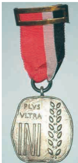
Medalla de plata Plus Ultra del INI (Instituto Nacional de Industria)

Tan sólo nos resta recordar que en los años 50 del siglo xx, se estableció en España una condecoración del INI (Instituto Nacional de Industria), con la denominación de Medalla Plus Ultra (no hay que confundirla con la anterior) que constaba de tres categorías: oro, plata y bronce. En todas las categorías la insignia era de forma irregular, semejante a un cuadrilátero y más larga que ancha. En la mitad izquierda del anverso (a la vista del espectador) podía leerse el lema que daba nombre a la condecoración « PLVS VLTRA » y, debajo, las siglas « INI » escritas con un tamaño muy superior a las letras del lema. En la mitad derecha de la medalla se encontraba reproducida una espiga de trigo.