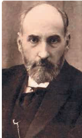
Don Santiago Ramón y Cajal, segundo español que recibió la medalla de oro «Plus Ultra»

del 24), en la persona de Santiago Ramón y Cajal. Siendo los únicos españoles dentro del elenco de galardonados.