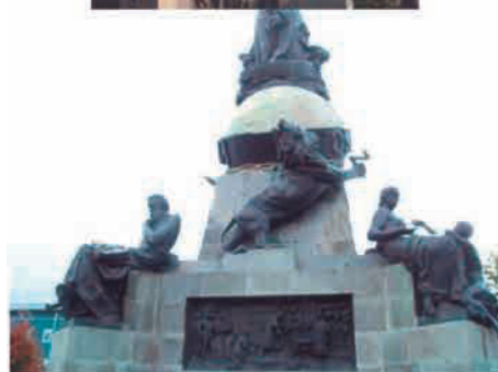
Monumento a Colón en la ciudad de Valladolid y detalle del mismo (obra del escultor Antonio Susillo)

El Susillo conocido en el mundo de la escultura es Antonio Susillo nacido en Sevilla el 18 de abril de 1857. Cuenta la leyenda popular que pasando un día la Infanta doña Luisa Fernanda de Orleans por