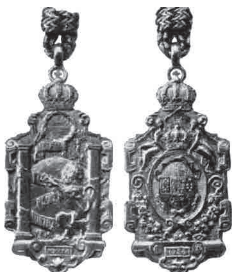
La medalla de oro «Plus Ultra» (anverso y reverso)

En el anverso de la misma figura el mundo entre las columnas de Hércules y pendiente de estas el lema «Non Plus Ultra», del cual un león aparece arrancando con su zarpa el «Non», según la genial idea del escultor Susillo. Encima de esta alegoría se muestra la palabra «España» y debajo la fecha: 1926. El reverso de la medalla lo constituye el escudo de España. Como remate ostenta la insignia de la Corona Real.