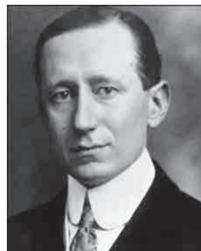
De izqda. a dcha.: Charles Lindbergh, Roald Amundsen y Guglielmo Marconi