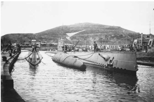
El submarino Peral en aguas de Cartagena, remolcado por el Cyclope (1929).