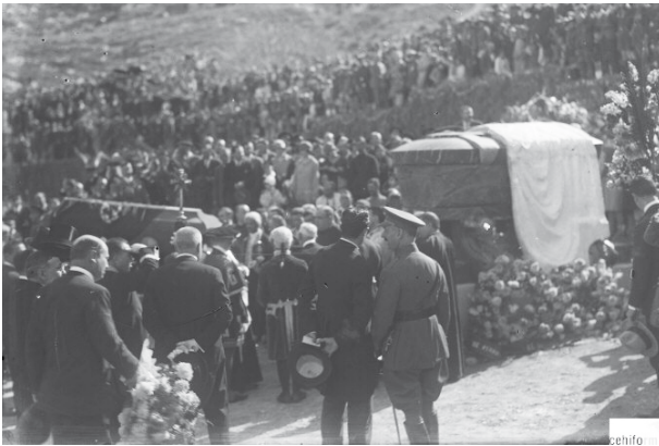
Llegada de los restos mortales del inventor a su mausoleo en el Cementerio de los Remedios (1927).

de Marina Don Álvaro de Bazán, que se encuentra en Viso del Marqués (Ciudad Real). En este archivo se pueden encontrar los numerosos planos del submarino o la memoria del mismo, realizados por el inventor, así como su hoja de servicios en la Marina, y demás documentos que testifican su paso por la Armada.