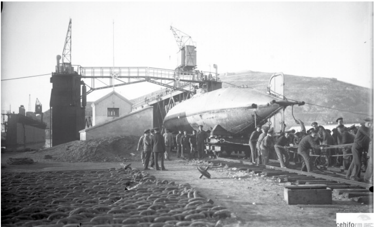
Mecanismo diseñado para el traslado del submarino del Arsenal al Paseo Alfonso XII (1929).

la que viajó por latinoamérica, desde Cuba a Filipinas pasando por Manila o la isla de Java, consagrado al mar, a la vida que había perseguido desde que era un niño en su Cartagena natal. En uno de estos viajes el marino sufrió un accidente que le provocó una lesión en la cabeza. Esta dolencia le acompañó durante toda su vida y le hizo retirarse de la vida de marino en activo.