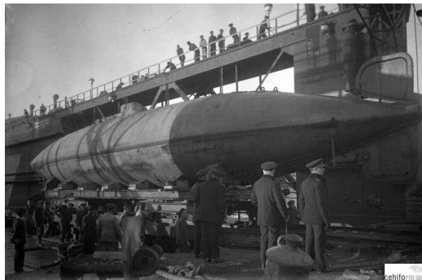
Submarino Peral en tierra, en el puerto de Cartagena (1929).

La Marina no se decidió a trasladar los restos del inventor al panteón de marinos ilustres, por lo que, debido al clamor popular surgido en la ciudad de Cartagena, la familia de Peral decidió su traslado a la ciudad portuaria que lo había visto nacer. El día 11 de Abril de 1911 el marino fue enterrado en el Cementerio de los Remedios. En 1927 se ordenó la construcción de un mausoleo digno de la categoría de tal personalidad, donde reposan hasta la actualidad. Este día señalado para la historia de Cartagena con su hijo predilecto fue tomado por la cámara de José Casáu, fotógrafo que captó la historia reciente de la ciudad, y cuyo archivo fotográfico se custodia en el Archivo General de la Región de Murcia.