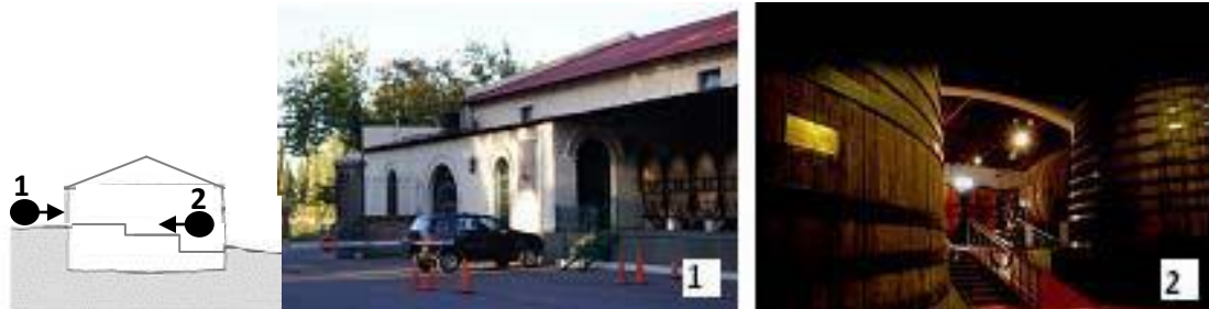
Figura 4: Esquema del edificio tradicional en el que se indican la ubicación de las fotografías, desde afuera y desde adentro, en donde se puede apreciar la diferencia de niveles del piso que potencia la pendiente natural del terreno. Figure 4: Traditional building scheme with indications of the location of the photographs, from outside and inside, in which it can be observed the difference in ground level that potentiates the land natural slope.