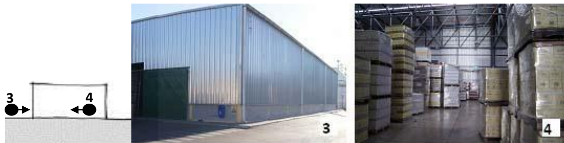
Figura 5: Esquema del edificio contemporáneo en el que se indica la ubicación de las fotografías, desde afuera y desde adentro, en donde se puede apreciar que el edificio se ubica sobre el terreno. Figure 5: Traditional building scheme with indications of the location of the photographs, from outside and inside, in which it can be observed that the building is placed on the land.

Las posibilidades de regulación de los intercambios energéticos interior – exterior se evalúan mediante la comparación de intercambios de flujos de calor para ambos casos a partir de la Ecuación de la Ley de Fourier (Ecuación 1).