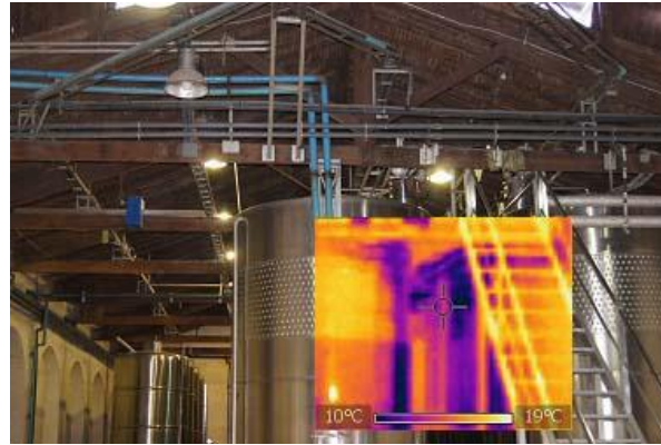
Figura 2: La envolvente tradicional. Fotografía e imagen termográfica.

construcción liviana y en seco, responde a motivos económicos y a la velocidad de construcción así como a la mínima interrupción del desarrollo de los procesos productivos en funcionamiento (Fig. 3).