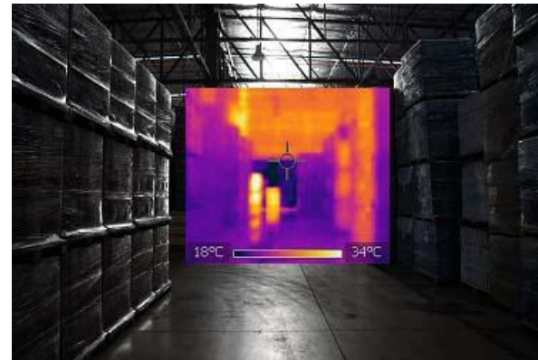
Figura 3: La envolvente tradicional. Fotografía e imagen termográfica.

Figure 2: Traditional envelope. Photography and thermographic image.