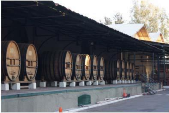
Figura 1: Bodega S.A. vista desde la galería de recepción de la uva y el lagar.

mayor potencia al mediodía solar. Las pérdidas por radiación de onda larga se aproximan a 180 \text{ W/m}^2 .