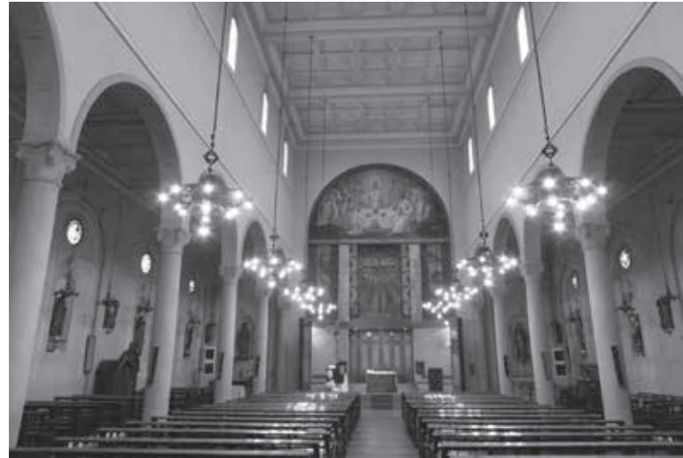
Interior de l'església parroquial de Mollerussa.

El Foment de les Arts Decoratives de Barcelona va crear també una Secció d'Orientació Litúrgica, que responia per escrit a les consultes que se li feien respecte de l'art per al culte. El Correo Catalán havia publicat el mes de desembre de 1939 una sèrie