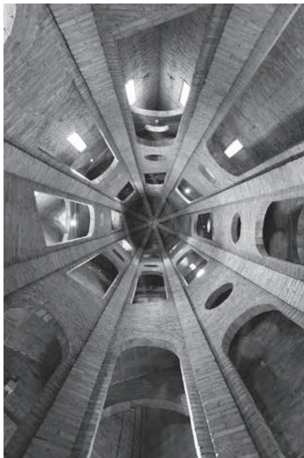
Interior del campanar de l'església de Mollerussa (fotografia finalista de la Marató fotogràfica del Pla d'Urgell. Autor: Antoni Tehàs).

Ens hem de situar ja al 22 d'abril de 1940 per saber de la visita a Mollerussa, al rector i al Sr. Argota, per tal de fer entrega del projecte de la nova església. Al dietari apareix la nota: "Vist el Sant Isidori, d'alabastre, per reconstruir". El mateix dia visita també l'església del Palau d'Anglesola, on autoritza la reconstrucció de la volta i demés obres urgents.