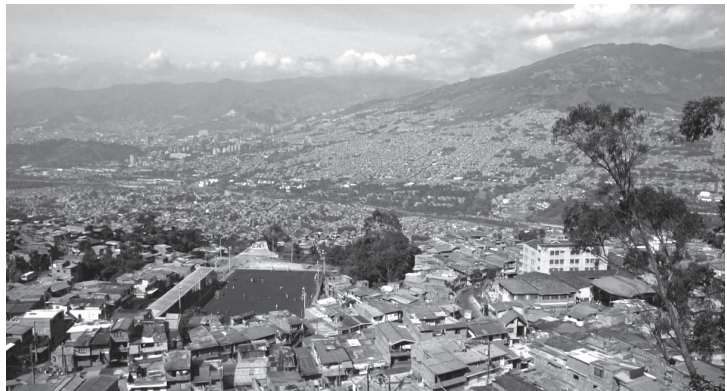
Figura 1. Unidad deportiva El Granizal, Medellín, Colombia. Equipamiento con el cual se promueve un buen uso del tiempo libre.

El cumplimiento de estas condiciones, sumado al importante papel dado a los equipamientos en la consolidación de estrategias de desarrollo urbano y social, se ha constituido en una de las principales características de algunos proyectos construidos recientemente en