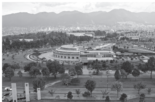
Figura 3. Biblioteca Virgilio Barco. Edificio emblemático que se integra al entorno mediante recorridos en varios niveles y espacios públicos que se convierten en la extensión del equipamiento. Diseño de Rogelio Salmona.