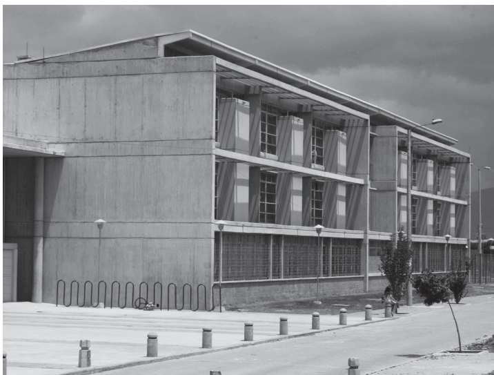
Figura 6. Colegio Carlo Federicci, Bogotá, Colombia. Uno de los colegios desarrollados por Álvaro Rivera Realpe y Asociados con base en el sistema de diseño. Fotografía: Álvaro Rivera Realpe y Asociados

4 Según Carlos Benavides: "es fundamental [...] comprender la amplitud e integralidad de la problemática del escenario para la educación, entender que no se puede limitar a contar con unas 'buenas instalaciones', si estas no aportan y motivan en los procesos de enseñanza y aprendizaje" ( Hábitat escolar , 120). Para Benavides el concepto de hábitat escolar va más allá de la arquitectura misma y propicia que el edificio escolar sea concebido como un ambiente integral en el que el entorno, la socialización y la participación hacen parte de la enseñanza.