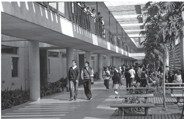
Figura 4. Colegio Gabriel Betancourt Mejía, Bogotá, Colombia. El corredor se transforma en una "calle" diseñada para propiciar el encuentro y la interacción. Diseño de Pedro Juan Jaramillo.