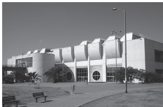
Figura 2. Biblioteca El Tintal Manuel Zapata Olivella. Proyecto que transformó una planta de reciclaje en un edificio remarcable, tanto en lo arquitectónico como en el impacto positivo que generó en su entorno. Diseño de Daniel Bermúdez.

En este contexto, uno de los ejemplos más significativos es la Red Capital de Bibliotecas Públicas, compuesta por cuatro bibliotecas mayores, seis locales, diez de barrio y un sistema de bibliotecas móviles. De esta experiencia se destacan dos logros importantes: por un lado, la decisión de ubicar las bibliotecas mayores en puntos de la ciudad distantes entre sí y alejados del centro tradicional permitió desconcentrar la oferta de equipamientos que hasta entonces se agrupaba principalmente en el área central. Por el otro, los nuevos edificios diseñados con los mejores estándares arquitectónicos se convirtieron en hitos y en motores para el desarrollo de nuevos proyectos en barrios con bajos estándares de calidad de vida que, desde la construcción del equipamiento, empezaron a transformarse (figs. 2 y 3).