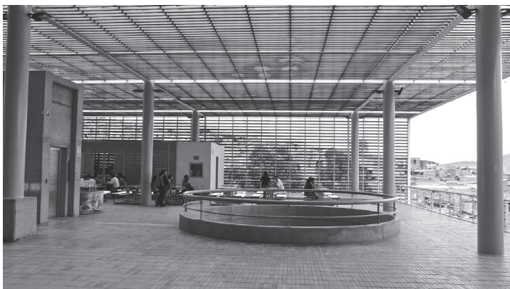
Figuras 8 y 9. Parque-Biblioteca Tomás Carrasquilla-La Quintana, Medellín, Colombia. Relación visual e integración de los espacios del equipamiento con los barrios vecinos. Diseño de Ricardo La Rotta.