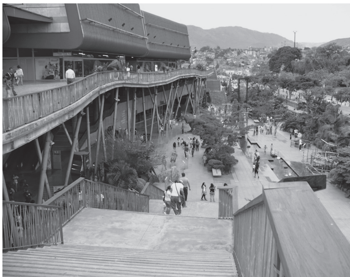
Figura 7. Parque Explora, Medellín, Colombia. Diseño de Alejandro Echeverri.