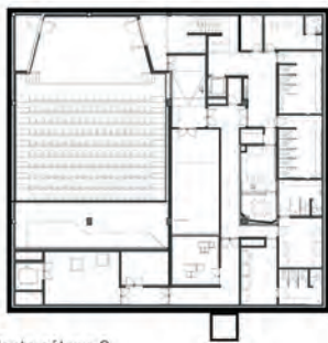
Planta sótano 2