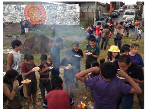
Taller de Activación Urbana, 2013, Comunidad Los Guido, Desamparados.