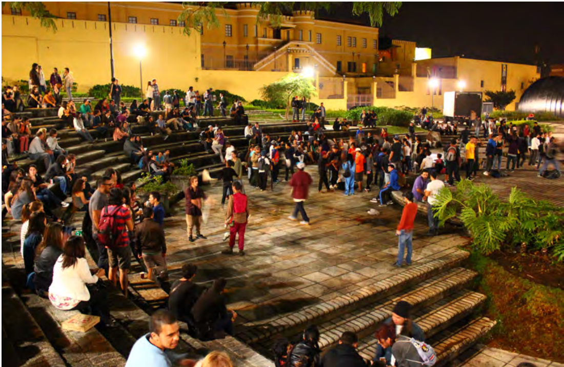
"La Noche vive la Plaza", Plaza de la Democracia (2010-2014).