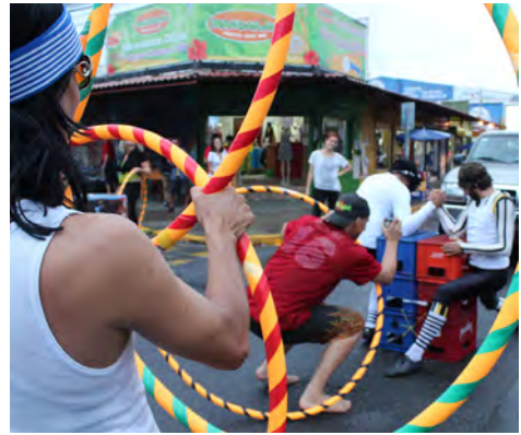
"Disfrutando la Amargura", Calle de la Amargura, San Pedro de Montes de Oca, 2012-2014.