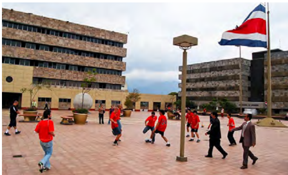
"Mejenguita a lo Legal", Plaza de la Justicia, San José, 2010.