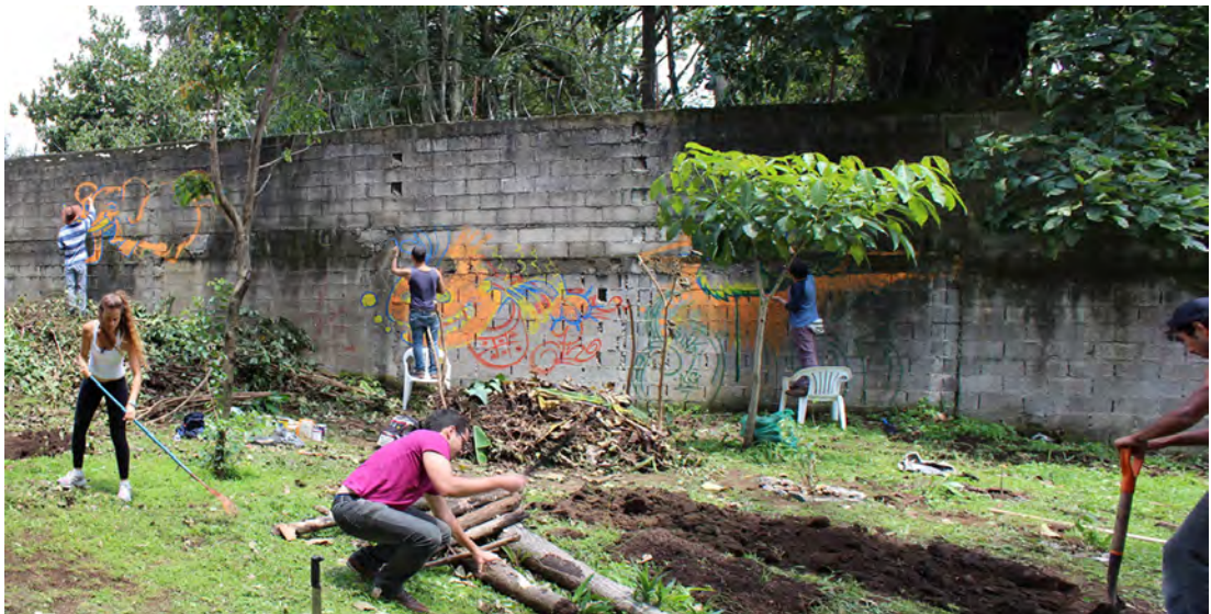
"Sembrando un Parque", barrio Freses, Curridabat, 2011-2014.