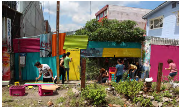
Taller de Activación Urbana, 2012, Universidad de Costa Rica.