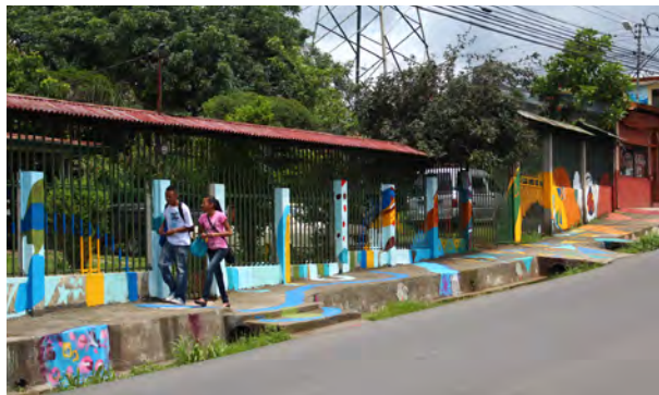
"Pasaje San Juan", San Juan de Dios de Desamparados, 2012.