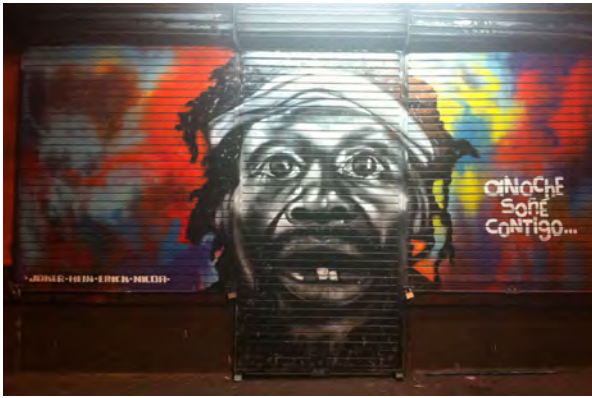
"Feria central/galería urbana", Avenida Central, 2013-2014.