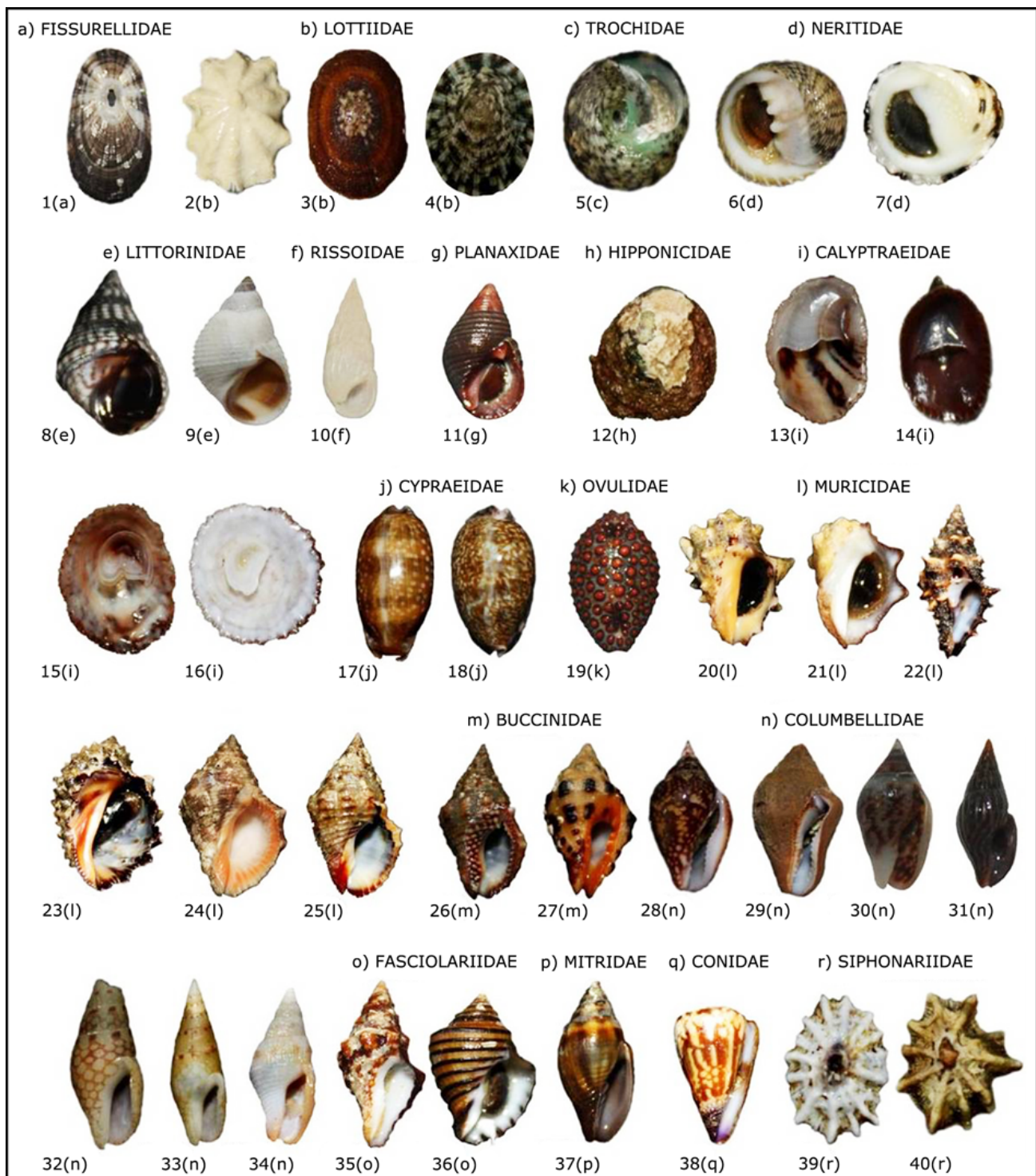
Figura 2. Especies de la clase Gastropoda con potencial económico de la región marina prioritaria 32, Guerrero, México. 1(a) Diodora inaequalis , 2(b) Lottia pediculus , 3(b) L. mesoleuca , 4(b) Tectura fascicularis , 5(c) Tegula (A.) globulus , 6(d) Nerita (C.) scabricosta , 7(d) N. (T.) funiculata , 8(e) Nodilittorina (N.) aspera , 9(e) N. (F.) modesta , 10(f) Rissoina (R.) stricta , 11(g) Planaxis obsoletus , 12(h) Hipponix delicatus , 13(i) Crepidula aculeata , 14(i) C. incurva , 15(i) Crucibulum (C.) scutellatum , 16(i) C. (C.) umbrella , 17(j) Macrocypraea cervinetta , 18(j) Mauritia arabicula , 19(k) Jenneria pustulata , 20(l) Mancinella speciosa , 21(l) M. triangularis , 22(l) Muricopsis (M.) zeteki , 23(l) Plicopurpura pansa , 24(l) Stramonita