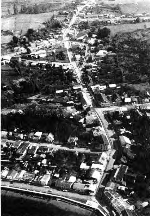
Vista aérea de la calle Centenario, Chonchi.

Chonchi fue uno de los escasos pueblos "mayores" o villas en la historia urbana del archipiélago de Chiloé. Pero actualmente, su escaso movimiento entrega una imagen alcaída que no se corresponde de la estatura urbana que presenció en épocas anteriores.