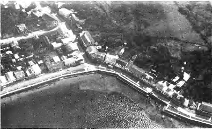
Vista aérea del sector puerto.