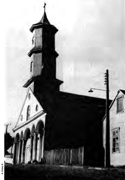
Iglesia de Chonchi, monumento nacional, construida en el siglo XIX. Es una de las pocas iglesias chilotas en que se reconoce un trazado ordenador en el elaborado diseño de su fachada neoclásica. Se trata, sin duda, de arquitectura "cultura".