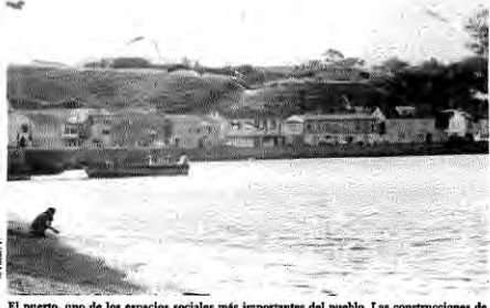
El puerto, uno de los espacios sociales más importantes del pueblo. Las construcciones de madera siguen la huella del mar en su borde continuo; desde aquí parte la calle Centenario que sube a la plaza.

CHONCHI ES HOY EN CHILOÉ UN NOTABLE Y UNITARIO CONJUNTO ARQUITECTÓNICO. SU SINGULAR TRAZADO Y LA CALIDAD DE SU IMAGEN AMBIENTAL REAFIRMAN HOYDÍA LA VALIDEZ DE LOS ANTIGUOS PRECEPTOS URBANOS QUE LO ORIGINARON.