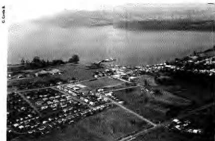
Nuevos crecimientos urbanos de la ciudad de Chonchi. La tradicional fachada continua ha sido reemplazada por la difundida lógica del sitio con viviendas aisladas y paradas. El espacio urbano resultante no corresponde en nada al tipo de espacio urbano que la ciudad ha forjado durante años.