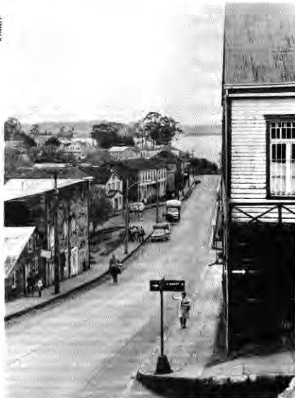
Calle Centenario en Chonchi. La ciudad es llamada "de 3 pisos", por su irregular situación topográfica. En la foto, el "3º piso".