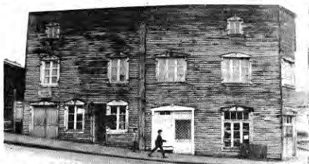
Una de las más singulares construcciones de Chonchi, fundamental en la imagen del pueblo: una volumetría emparentada con las formas racionalistas, pero de ornamentación neoclásica. "Nail" elaborado, o reinterpretación ingeniosa de los estilos.