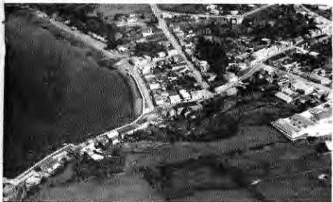
Vista aérea del puerto y calle Centenario.