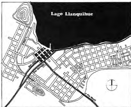
Plano de Puerto Varas. En negro, el área central de la ciudad, y líneas urbanas principales.

PUERTO VARAS FUE FUNDADA POR VICENTE PÉREZ ROSALES EN 1852. SE LE DIO EL NOMBRE EN HOMENAJE AL ENTONCES MINISTRO DEL INTERIOR, DON ANTONIO VARAS, QUIEN APOYÓ EN FORMA DECIDIDA LA LLEGADA DE COLONOS A ESA REGIÓN.