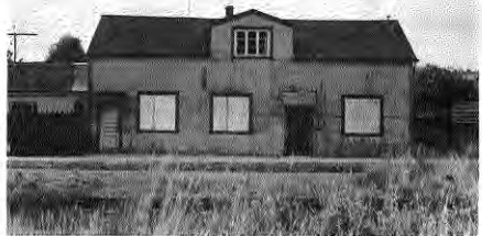
Fusión de 2 culturas en la arquitectura popular de Puerto Varas: Esta "casa chilota" de curiosas proporciones está recubierta íntegramente en latón.