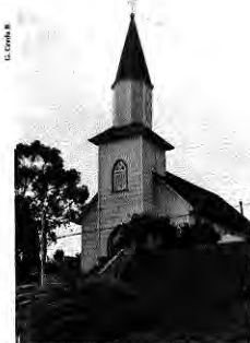
Iglesia Evangélica Luterana en Puerto Chico.

Tiene particular valor este edificio, porque habla de un momento de búsqueda de lo propiamente regional, y en especial porque hace suponer un cuarto momento de la arquitectura de Puerto Varas, todavía por venir, en que este objetivo esté totalmente conseguido.