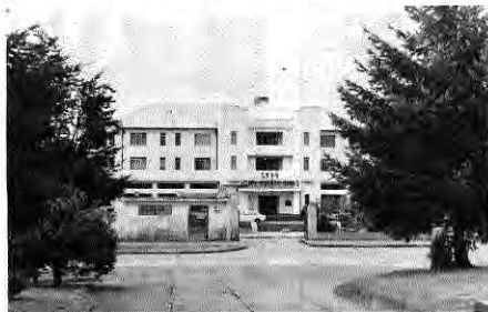
Gran Hotel Puerto Varas.