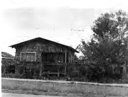
La "casa prefabricada", en teja. Las carencias urbanas sin embargo, son las típicas de este modelo.