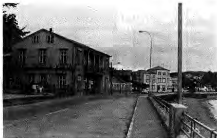
En primer plano el Hotel Bella-Vista. Más atrás, el Playa Hotel.