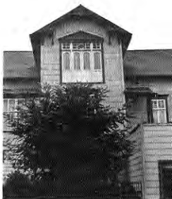
chimbreado horizontal. El otro revestimiento habitual es el fierro galvanizado estampado.

LA ARQUITECTURA SURGIDA EN EL ÁREA PUERTO MONTT - PUERTO VARAS TIENE SUS RAÍCES EN LA ARQUITECTURA ALEMANA LLEGADA CON LOS COLONOS A MEDIADOS DEL SIGLO XIX, Y EN LA RICA TRADICIÓN MADERERA DE LA ARQUITECTURA CHILOTA, YA ASENTADA EN EL ARCHIPIÉLAGO A PARTIR DEL SIGLO XVI.