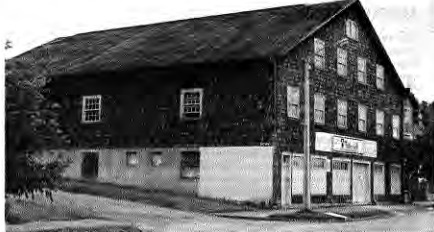
Bodega de roble y alerce. Barrio ultra estación.