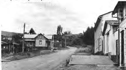
Casas quintas de la periferia portovarina.