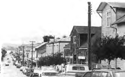
Calle Del Salvador. Al fondo, el Lago Llanquihue.

Con todo, desde el punto de vista arquitectónico, y paradójicamente en contraste con la mayoría de las ciudades chilenas, a continuación veremos cómo Puerto Varas es uno de esos escasos ejemplos en que la periferia—con sus casas quintas y barrios populares—es aún más interesante que el centro.