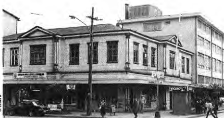
Área central de la ciudad. En primer plano, edificio de madera, propio de la primera arquitectura de Puerto Varas. Costiguo a éste, un edificio en albañilería de 5 pisos, recubierto en calugas Murigías.