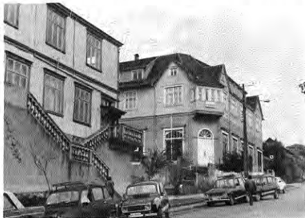
Viviendas de madera en calle Del Salvador.

LA ARQUITECTURA SURGIDA EN EL ÁREA PUERTO MONTT - PUERTO VARAS TIENE SUS RAÍCES EN LA ARQUITECTURA ALEMANA LLEGADA CON LOS COLONOS A MEDIADOS DEL SIGLO XIX, Y EN LA RICA TRADICIÓN MADERERA DE LA ARQUITECTURA CHILOTA, YA ASENTADA EN EL ARCHIPIÉLAGO A PARTIR DEL SIGLO XVI.