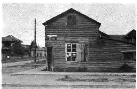
Almacén de la esquina: El ochavo del acceso produce una verdadera "quilla" en el 2º piso.