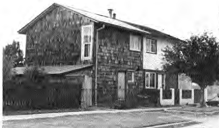
La típica casa de población, convertida en "casa del sur" gracias a la incorporación de la teja de alerce.

Toda esta rica variedad es respetuosa de ciertos principios: Prevalece la sobriedad sobre la ostentancia; el continuo sobre el aislado; el material propio sobre el importado; la diversidad sobre la seriatin. Esta arquitectura popular es parte constitutiva de una rica cultura y tradición arquitectónica sureña.