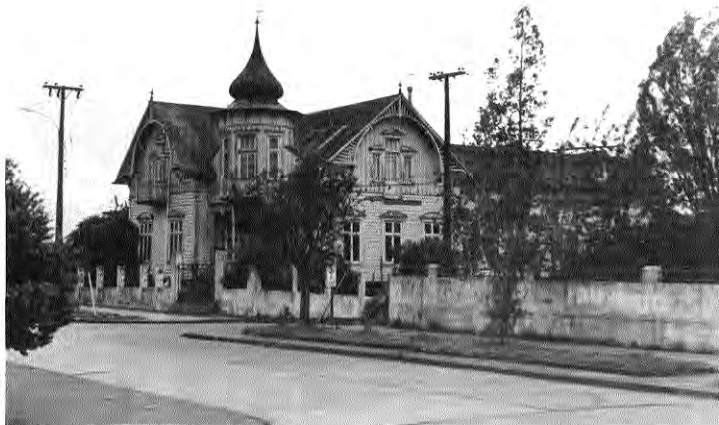
Vivienda en madera en frente a la estación de Puerto Varas.