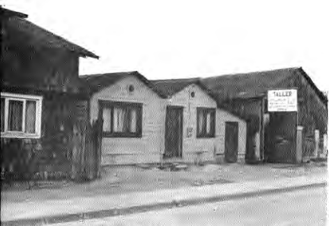
Vivienda en madera de un piso, color amarillo y 2 notables ventanillas "ojo de buey" en los frontones.