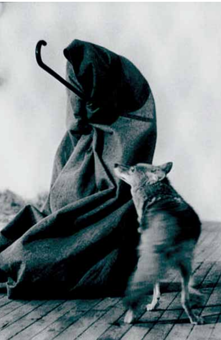
2 "I like America and America likes Me". Joseph Beuys (1974)