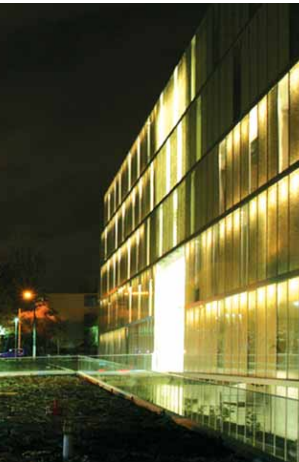
8 Edificio Simonetti. Undurraga + Devés Arquitectos (2005)