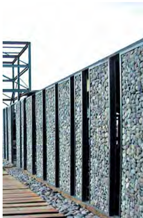
6 Acceso Parque Metropolitano Sur. Polidura + Talhouk Arquitectos (2006)