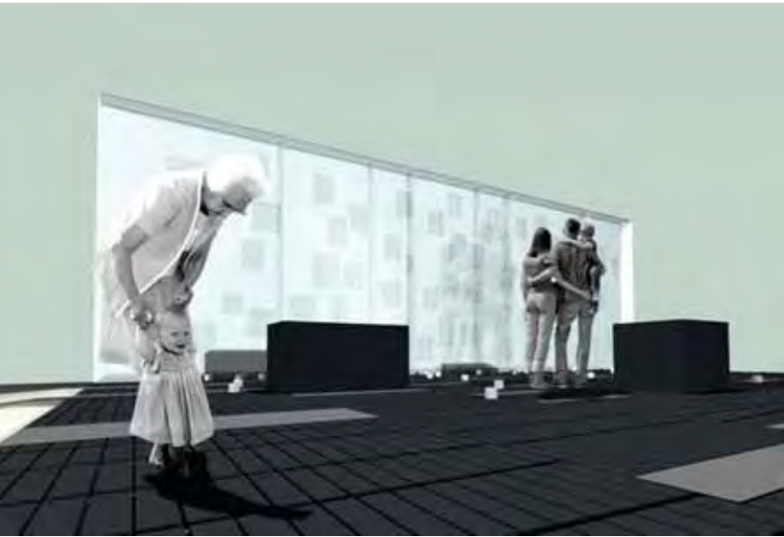
7 Memorial a las mujeres víctimas de la represión política. Emilio Marín + Nicolás Norero (2005)