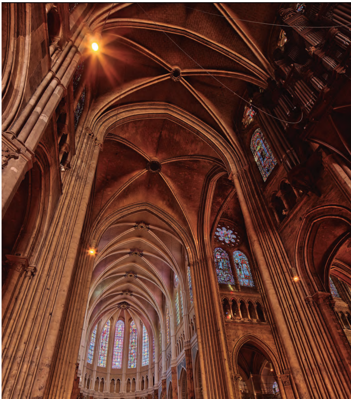
Figura 3 Interior de la Catedral de Chartres.