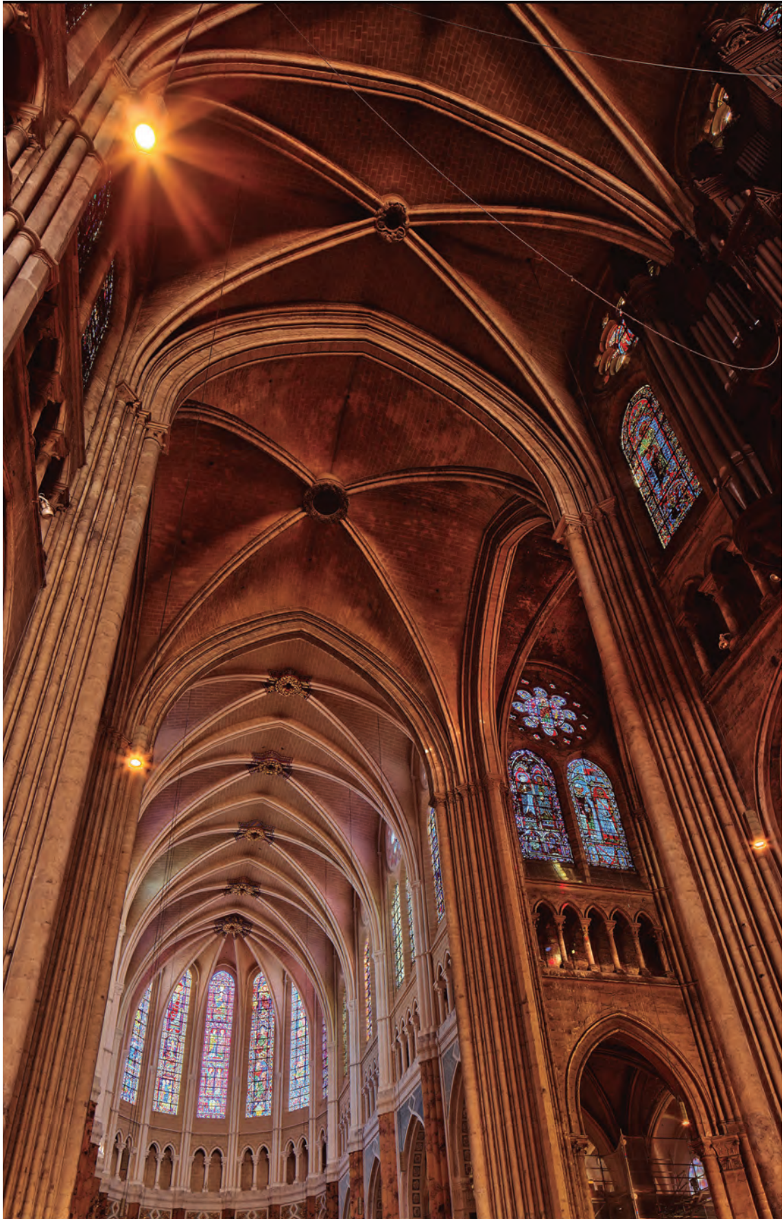
Figura 0 Interior de la Catedral de Chartres.