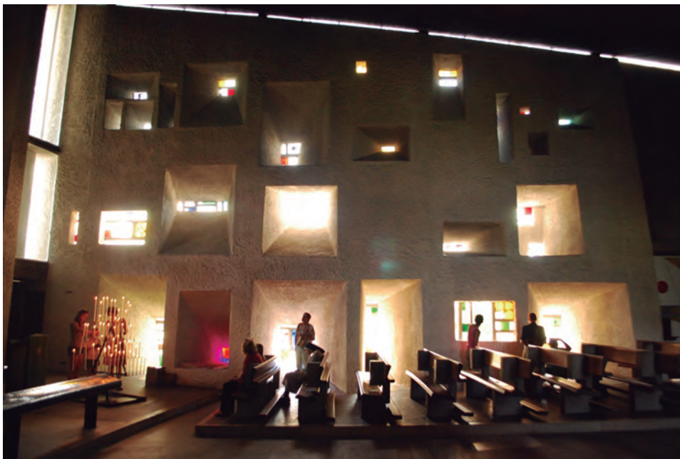
Figura 4 Interior de la Capilla de Ronchamp.

de lo bello. El poder de la belleza para invitar a estados trascendentes fue normalmente aceptado por milenios tanto por la gente común como por los filósofos más sofisticados 11 (Nehamas, 2007). Segundo y relacionado a lo anterior, el resultado de nuestro estudio nos recuerda cuán ausente está la estética contemplativa de los intereses disciplinarios de hoy, tan obsesionados con el mercado, la funcionalidad, la tecnología, la sustentabilidad, o la política social. Quizás nuestro olvido de la belleza tiene que ver con nuestra forma consumista, secular, práctica, y científica actual de relacionarse con el mundo. Los buenos edificios religiosos nos enseñan que la belleza arquitectónica puede ser un instrumento útil para resensibilizarnos con nuestra naturaleza exterior e interior. Finalmente, los comprobados beneficios cognitivos, emocionales y físicos que la práctica meditativa produce en el ser humano (D'aquili, 2000: 39-51) (Davidson, 2008: 388-389) (Davidson, 2004: 1395-1411) (Moore, 2009: 176-186) indican que una arquitectura que regularmente induzca estados contemplativos en la gente (como la que estudiamos en esta ocasión) puede tener efectos realmente positivos en aquellos expuestos a la misma. Esto en turno nos puede proveer de estrategias y lógicas