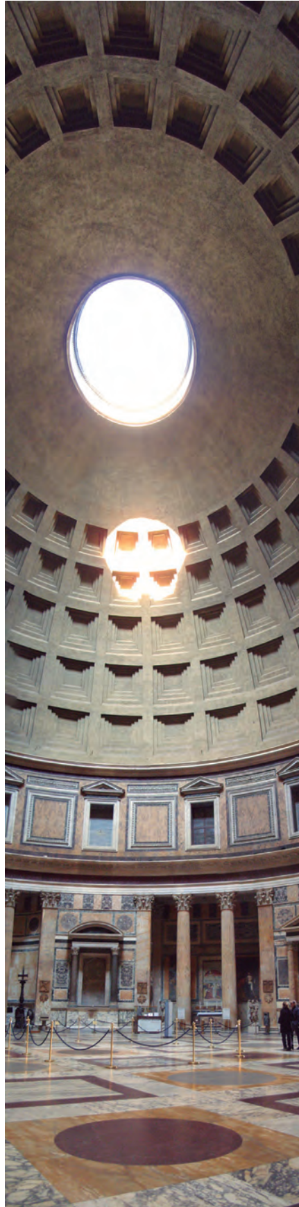
Figura 2 Interior del Panteón.