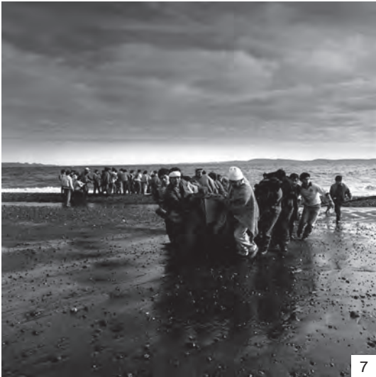
Figuras 2 a 7 Imágenes de la exposición ADOREMOS aportadas para este artículo por la fotógrafa Mariana Matthews / Images from the ADOREMOS (LET US WORSHIP) exhibition provided for this article by the photographer Mariana Matthews