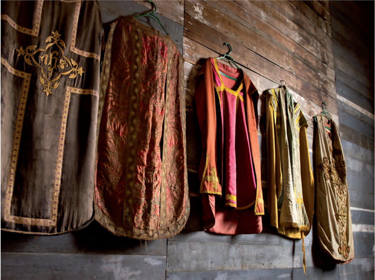
Figura 1 Casullas, parroquia de Dalcahue/ Casullas, parish of Dalcahue.