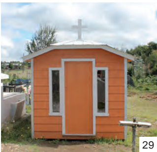
Figuras 15, 16, 17, 19 y 20 casa tumba madera, Teupa/ Figuras 18, 21, 22, 23, 24, 25, 27 y 28 casa tumba zinc, Teupa/ Figuras 26 y 29 casa tumba fibrocemento, Teupa/ Figures 15, 16, 17, 19 & 20 timber tomb construction, Teupa/ Figures 18, 21, 22, 23, 24, 25, 27 & 28 zinc sheet tomb construction, Teupa/ Figures 26 & 29 fibre cement tomb construction, Teupa