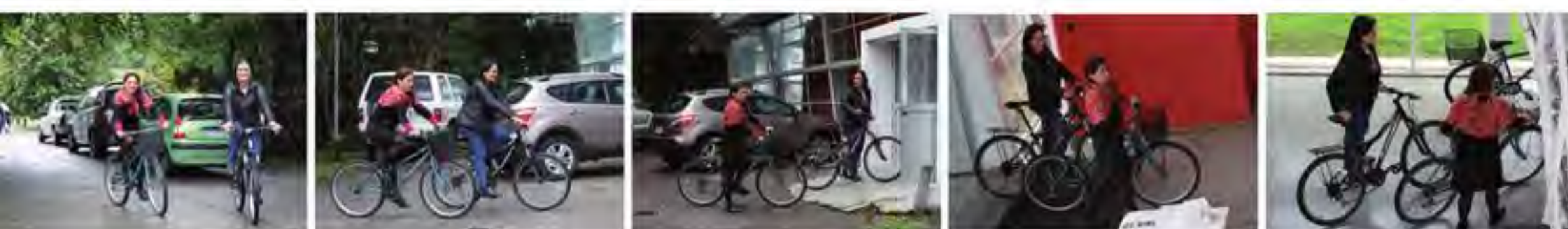
Secuencia: "Cómo Laura y yo llegamos al trabajo en bicicleta, mientras no se largue el aguacero valdiviano"