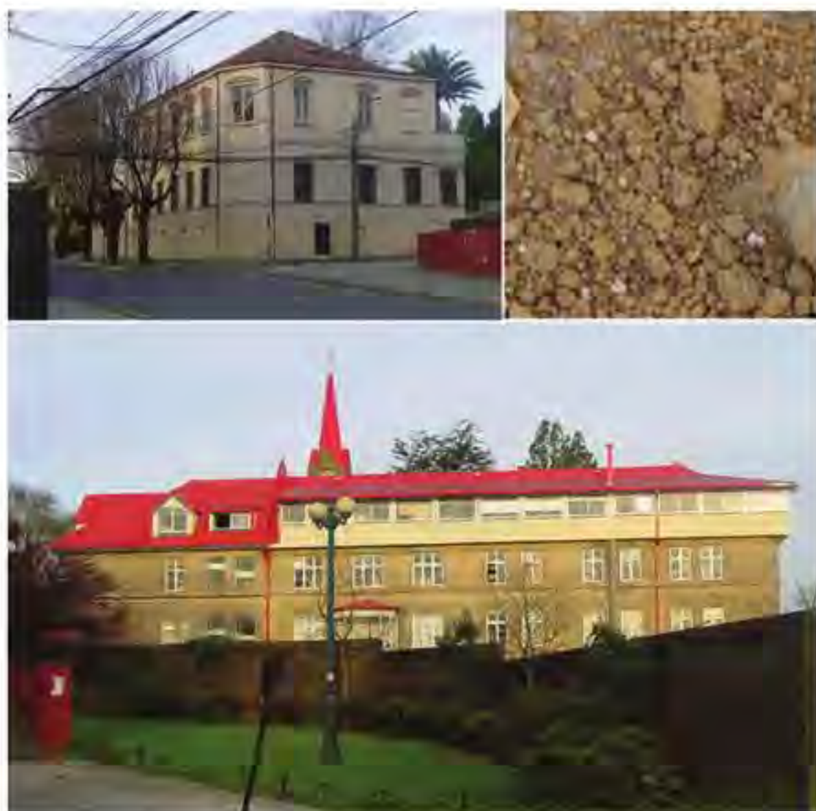
Figura 4. Aquí se aprecian los matices del contexto existentes en las edificaciones aledañas al proyecto y también el amarillo-ocra de la tierra del terreno sobre el cual fue construido el proyecto.

El proyecto cromático para el conjunto de casas, constituido como condominio, fue planteado desde un principio como un conjunto con presencia urbana, por lo que, tanto la elección de colores como la composición de éstos, tuvo en cuenta la totalidad, estructurando una articulación entre las viviendas y la espacialidad de las cuales eran parte, incluyendo su relación con la calle General Lagos. La propuesta final de color contempló la repetición desfasada de los colores para evitar la monotonía y la diferencia de valor del color en altura, siendo más claro el segundo piso, para favorecer la iluminación. Además, en concordancia con la historicidad de la calle General Lagos, el Concejo de Monumentos Históricos requirió que las dos primeras casas fuesen pintadas de amarillo.