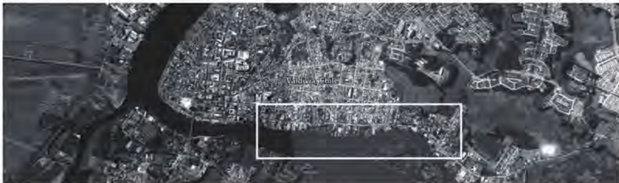
Figura 1a Ubicación de la calle General Lagos a lo largo del río Valdivia.