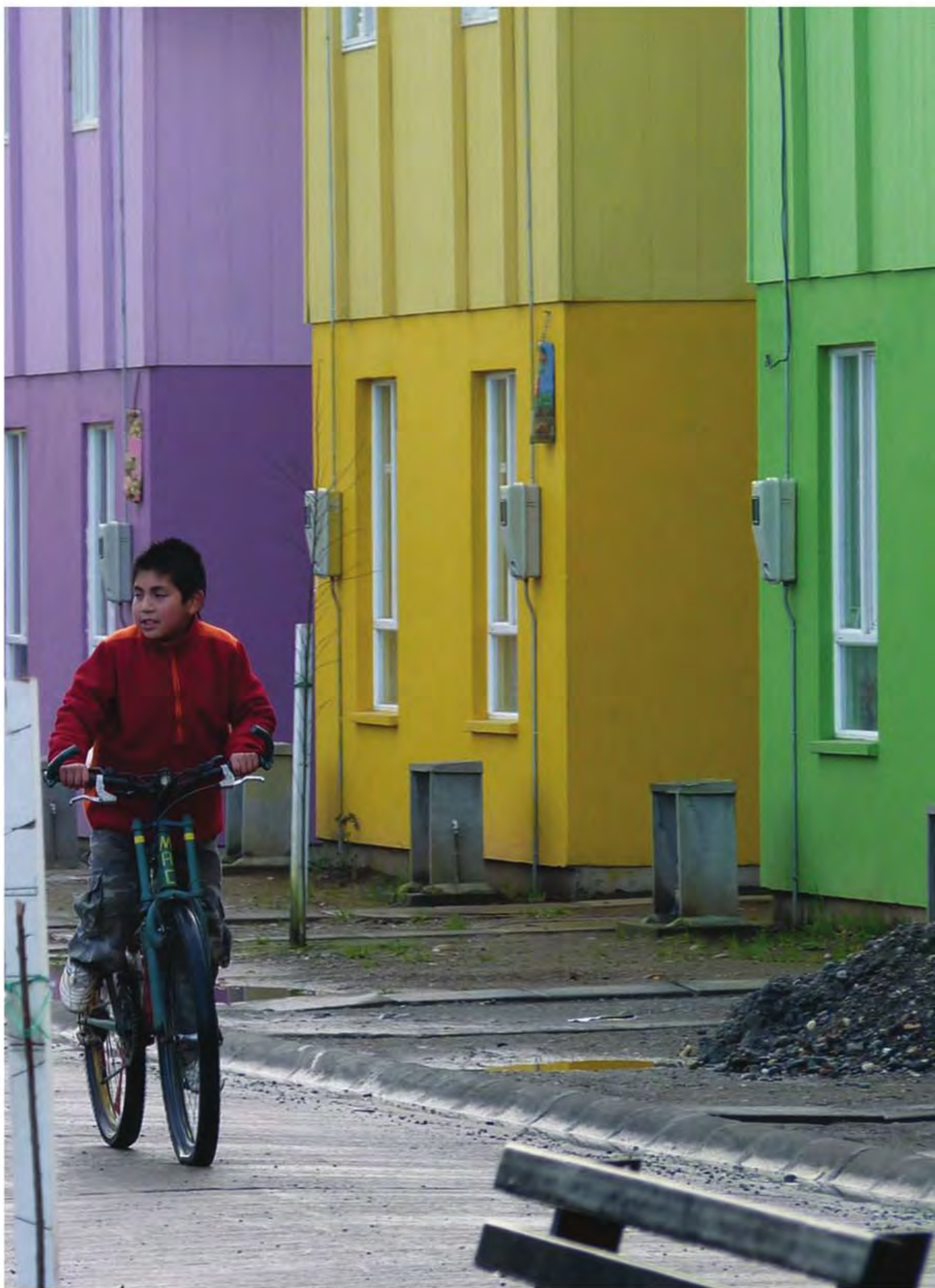
Figura 0 La propuesta de colores del condominio, producto de una metodología transdisciplinaria y colaborativa, es valorada por las familias y por los vecinos de la calle General Lagos.