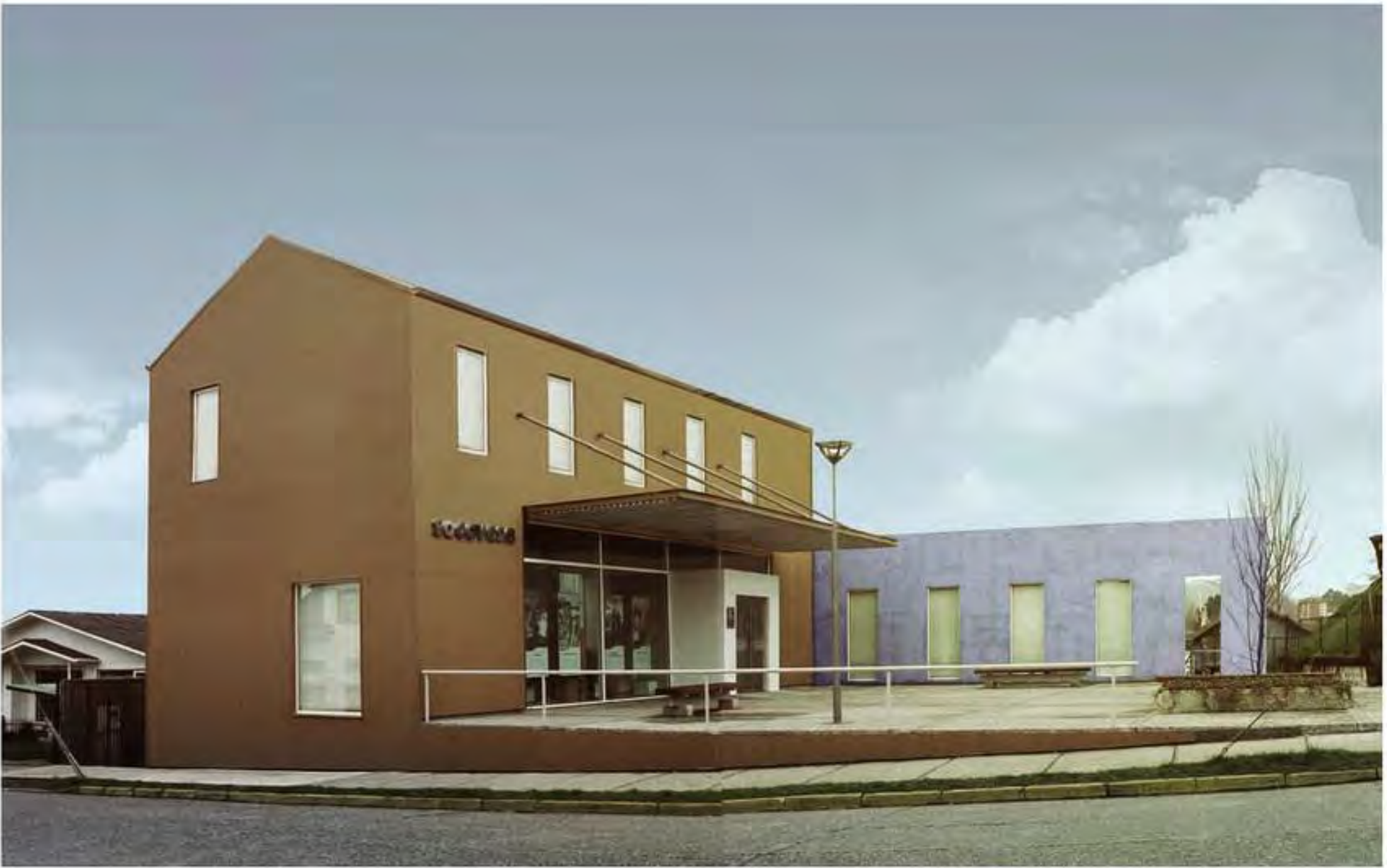
Figura 6 El edificio corporativo amarillo oscuro, la plaza cedida a la ciudad y el muro gris-azulado, entre la calle zona típica General Lagos y el río Valdivia. A la derecha, el callejón Orella hacia el río.