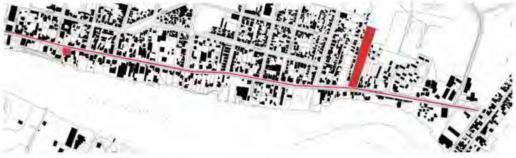
Figura 1b Sector de la calle General Lagos por el que se estudia el color en las viviendas y el color asociado a la zona de condominio de viviendas social.

urbana. Bajo esta condición, el color se manifiesta como un elemento conector, el cual muchas veces acontece de manera desapercibida en la conciencia pública, sin embargo va formando un aspecto clave de nuestro sistema de subsistencia, de comunicación, de identidad y en última instancia, de emociones que desencadenan estados subjetivos.