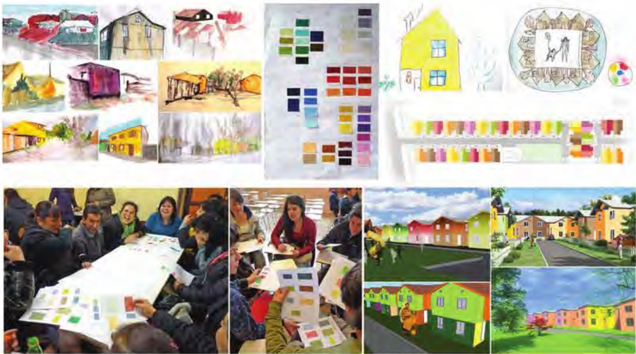
Figura 3 Cuadro síntesis de actividades realizadas, de izquierda a derecha. Arriba: croquis atmosféricos realizados por estudiantes, carta de colores sintetizada a partir de las 3 tareas, dibujos del imaginario de las familias, planta del condominio con colores definitivos. Abajo: Taller de color con familias del comité de vivienda, estudiantes de arquitectura trabajando en la segunda carta de color, distintos anteproyectos de color para el condominio.

los edificios existentes entre los que hay una antigua iglesia y su seminario, un edificio patrimonial -propiedad de la Universidad Austral de Chile- edificaciones defensivas -de la época de la colonia española- y el río Valdivia. Este estudio evidenció la presencia del color amarillo en distintas tonalidades sobre varias construcciones de esta calle, tanto antiguas como modernas. Se realizó además un relevamiento cromático de las casas importantes que rodeaban el proyecto. Por otra parte se recopilamos muestras de material encontrado en el lugar, como tierras y restos de ladrillo y canchagua, dentro de los cuales destaca la tierra removida por la constructora in situ, de color amarillo oscuro. También se incluyó el estudio cromático del río que, aunque invisible desde la calle, se accede a él a través del callejón Orella, antiguo acceso a un muelle. El color del río depende del color del cielo, y tomando en cuenta el clima lluvioso de Valdivia, generalmente es de un gris azulado, color que apareció de observaciones durante varios momentos en un periodo de tiempo. Paralelamente, se realizó una investigación histórica sobre el lugar, la cual reveló el enorme peso histórico tanto de la calle, como de las construcciones aledañas.