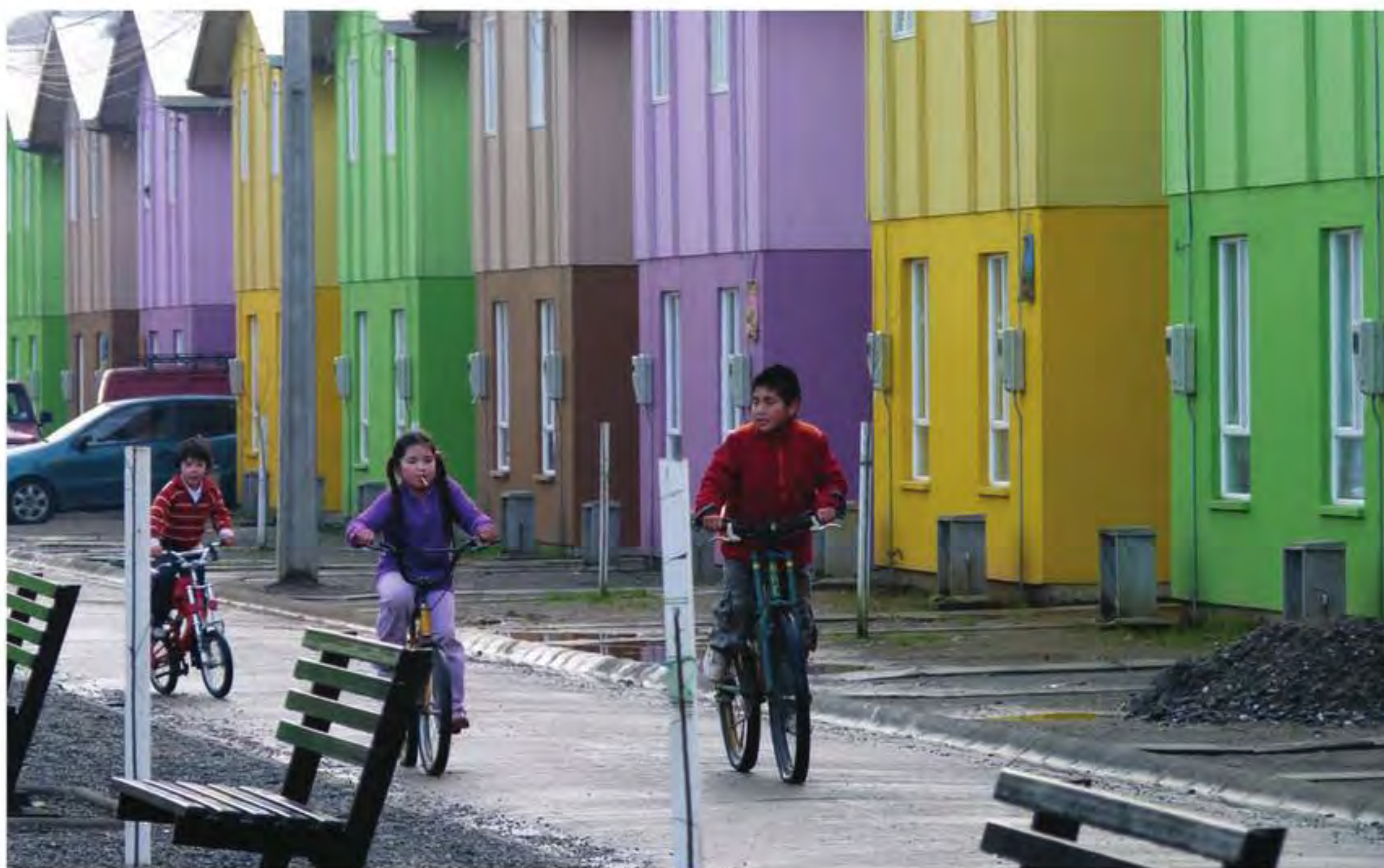
Figura 5 La propuesta de colores del condominio, producto de una metodología transdisciplinaria y colaborativa, es valorada por las familias y por los vecinos de la calle General Lagos.