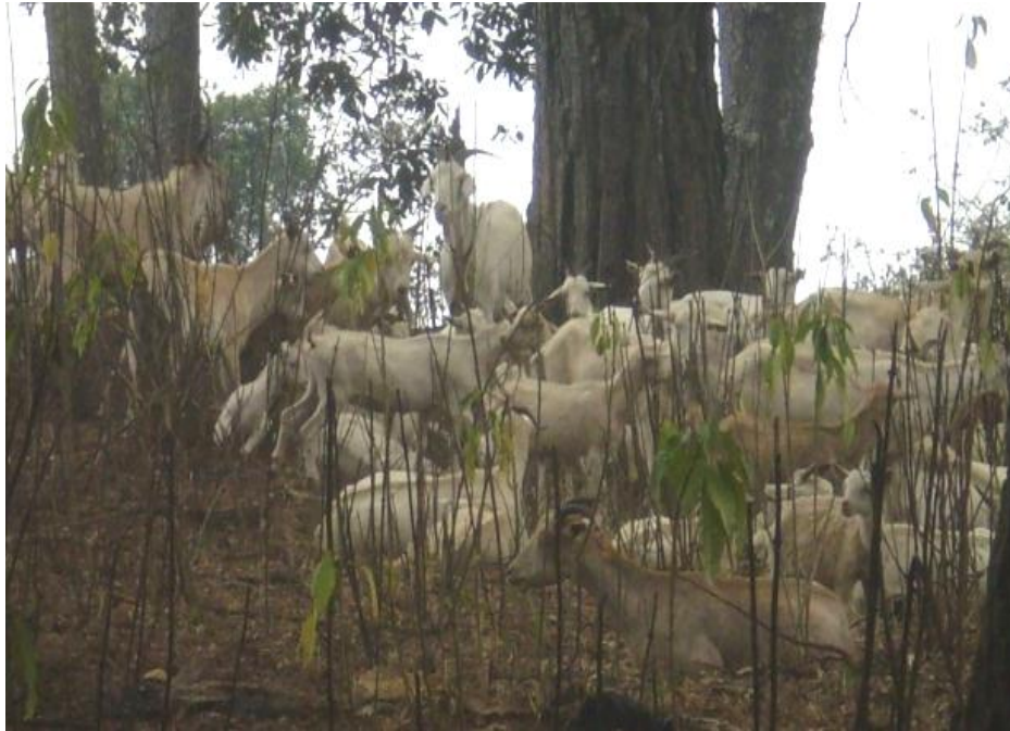
Figura 1. Vista parcial de un rebaño de cabras blancas Criollas en la sierra del “Filo Mayor”

sementales (Figura 2). Estos fueron apareados durante el otoño (octubre-noviembre) por monta natural (dos servicios por cabra), previa detección de estro con un macho cabrío “celador”.