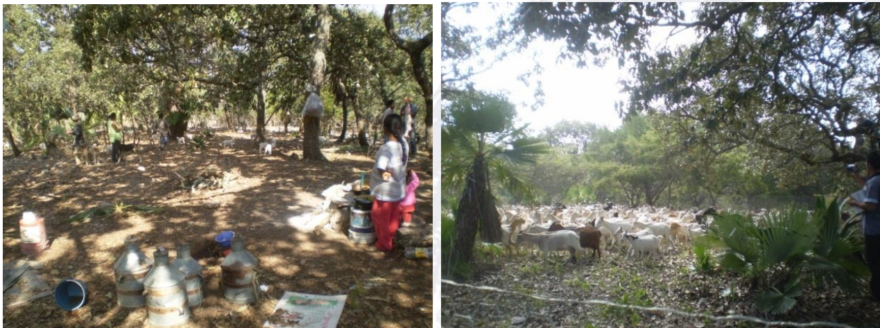
Figura 4. Vistas del campamento temporal conocido como “jato”

En la región de la montaña es donde ocurren los partos en los meses de enero y febrero y los pastores concentran a las cabras paridas cerca del “jato” durante los primeros 15 días después del parto. Pasadas estas dos primeras semanas, atan a las crías con una cuerda hecha de palma en una estaca de madera, mientras sus madres salen a pastorear. Una vez que los cabritos han alcanzado los 30 días de edad, se les permite salir al agostadero con su madre junto al resto del rebaño. Los cabritos permanecen siempre con la madre hasta que se destetan de manera natural entre los 3 a 4 meses de edad. Los pastores, según los manifestaron, no realizan castración porque venden a sus machos antes de que alcancen la pubertad (alrededor de los 5-6 meses de edad) sin ningún problema y a buen precio; pero cuando es necesario lo hacen con navaja y utilizan sal para desinfectar la herida como único tratamiento. La forma de identificación utilizada por los productores es por medio de una “muesca en la oreja”.