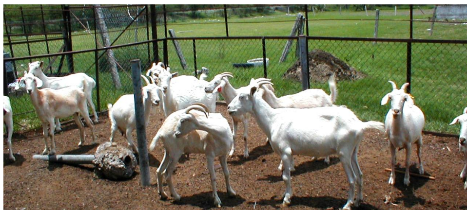
Figura 2. Vista del rebaño de cabras Criollas del “Filo Mayor” estudiadas en el CSAEGRO

Como consecuencia del periodo de fecundación estacional realizado en el otoño, durante los meses de marzo-abril se registraron los datos del comportamiento reproductivo. Se anotó la duración de la gestación, y para determinar el inicio de la actividad ovárica posparto en las cabras (intervalo parto-primer estro), después del parto se realizaron detecciones diarias de estro en el rebaño utilizando machos cabríos con mandil. Los niveles de progesterona plasmática, indicativos de la presencia de cuerpo lúteo y, por tanto, de ovulación, se obtuvieron mediante la técnica de radionmunoanálisis (RIA) en fase sólida (Srikandakumar et al. , 1986).