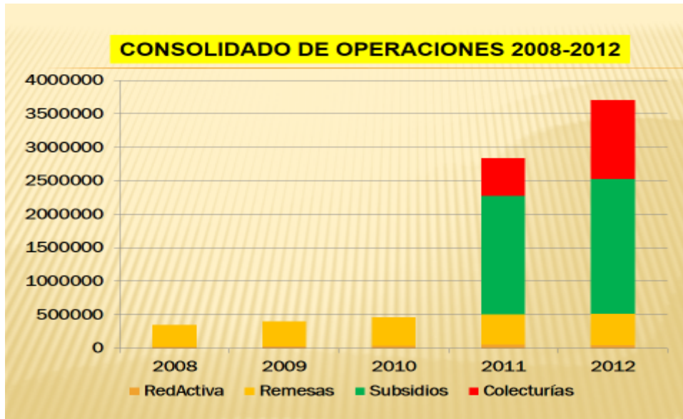
Figura No.6 Consolidado de operaciones 2008 – 2012.

El incremento de operaciones se presenta gráficamente: