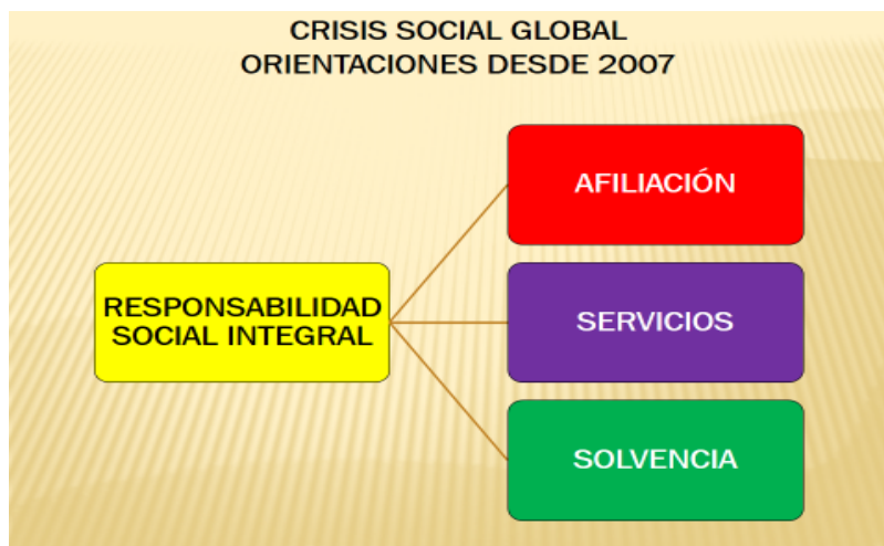
Figura No. 2 Orientación de la Responsabilidad Social.