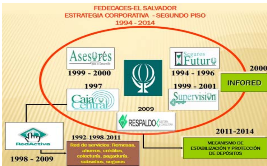
Figura No. 1 Estrategia Corporativa FEDECACES.

La crisis global iniciada con el sector crediticio inmobiliario desde el 2007, ha dado la razón, a toda la estrategia de previsión del fortalecimiento institucional del SCFF.