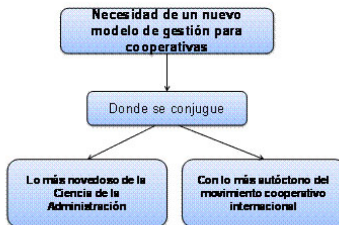
Figura 2. Necesidad de un modelo de gestión cooperativo.

Lo anterior justifica la existencia de un nuevo modelo de gestión para cooperativas.