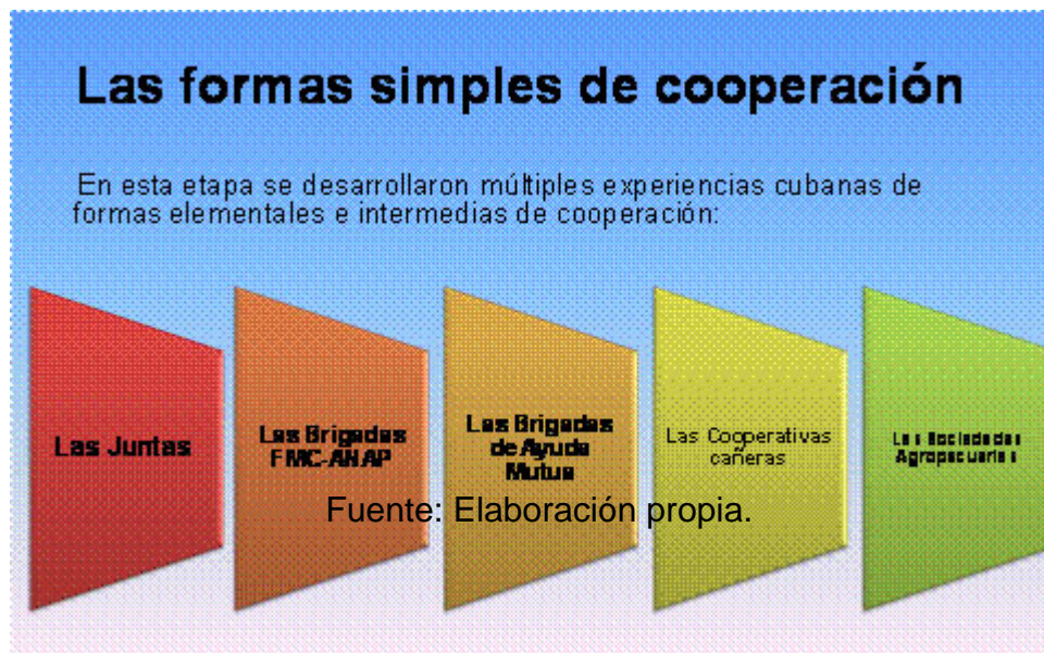
Figura 3. Formas simples de cooperación.

El cooperativismo en Cuba ha atravesado por distintas etapas, las que se reflejan en el cuadro 2.