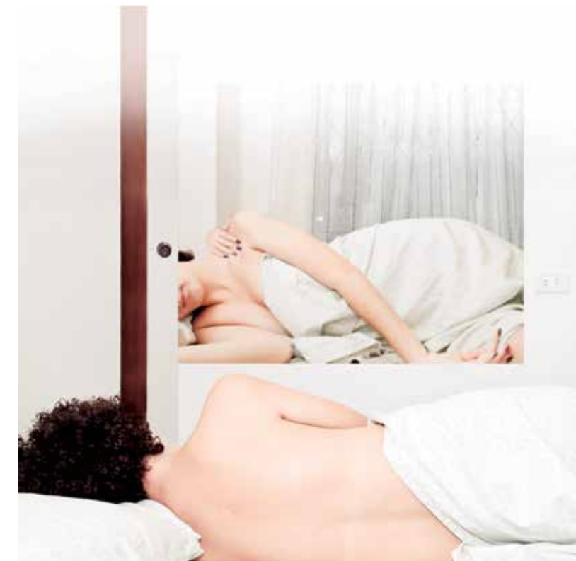
▲ Asuntos de u espejo, en: Nunca me cansaré de acariciarte (pieza 1), Fotografía: Cristal Murillo. 2014

(...) ser cuerpo quiere decir existir mundanamente en el doble sentido de "ser-en" y "ser-del-mundo", tal como puede decirse con el vocablo francés de estilo heideggeriano empleado por Merleau-Ponty (...) que une en un solo término ambas caras de la relación corporalidad mundo: Por un lado, que el "cuerpo es nuestro anclaje en el mundo". En segundo lugar, el cuerpo es caracterizado como existencia inter-mundana, porque el mundo en el que estamos, del que somos, y del que nos hacemos por la corporalidad vivida es un "mundo-entre" o "inter-mundo", en tanto en cuanto que es un mundo constitutivo intersubjetivamente y que él es el que media constantemente en todas nuestras interacciones. Y en tercer lugar, cabe decir, en fin, que el cuerpo es existencia carneal inter-mundana, porque es en tanto que carne que el cuerpo propio vivido es simultáneamente un estar el mundo, un darse al mundo y un dárseos (el / un) mundo. (Muñoz Terrón, 2007: 191)