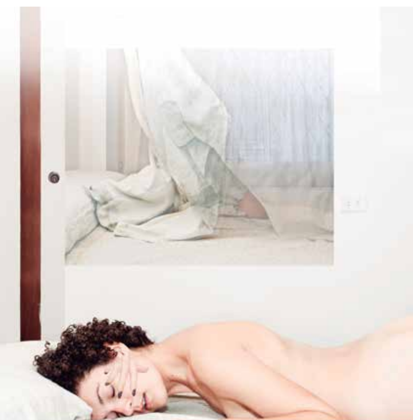
▲ Asuntos de u espejo, en: Nunca me cansaré de acariciarte (pieza 3), Fotografía: Cristal Murillo. 2014