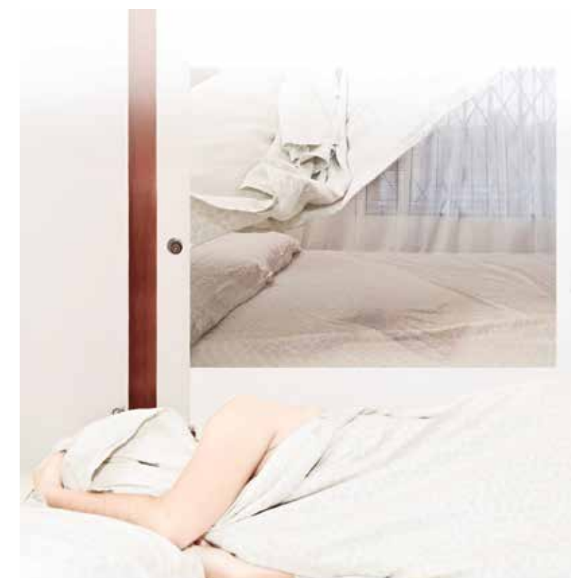
▲ Asuntos de u espejo, en: Nunca me cansaré de acariciarte (pieza 5), Fotografía: Cristal murillo, 2014

(...) cuando se trata de adquirir la ciencia, verdadero objeto y fin de la filosofía, el cuerpo es verdadero obstáculo, pues incluso los sentidos cuales la vista y el oído, que consideramos como los más perfectos, no ofrecen certeza alguna sobre las cosas, habremos de convenir que solo separando el alma del cuerpo, que no hace sino inducirla al error, puede ayudada del razonamiento que será tanto más perfecto cuanto más se aleje y aisle de los sentidos y de cuanto tenga contacto con el cuerpo para llegar a la perfección. (Platón, 1989: 225)