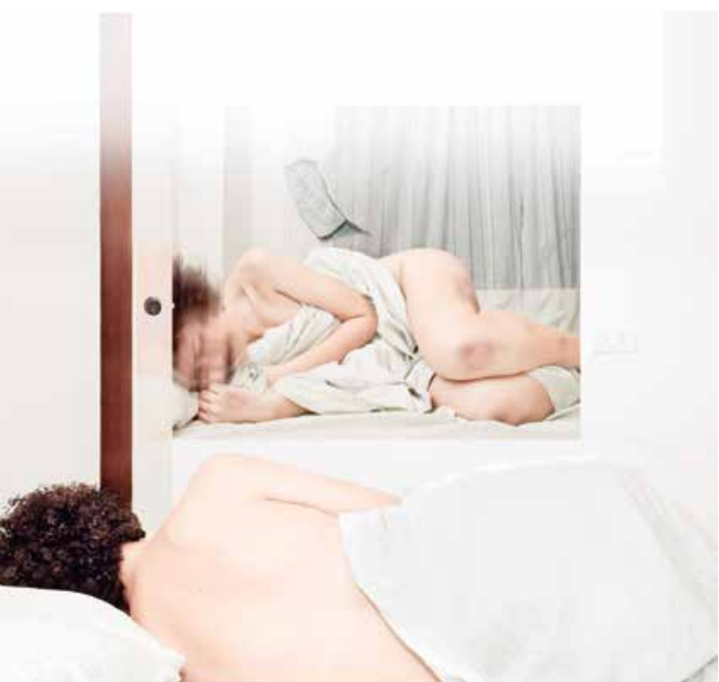
▲ Asuntos de u espejo, en: Nunca me cansaré de acariciarte (pieza 4), Fotografía: Cristal Murillo. 2014

El cuerpo y el mundo están hechos de carne, dice Merleau-Ponty: "El espesor del cuerpo, lejos de rivalizar con el mundo, es, por el contrario, el único medio que tengo para ir hasta el corazón de las cosas, convirtiéndome en mundo y convirtiéndolas a ellas en carne." (Merleau-Ponty, 1966: 169)