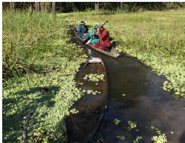
Figura 2. Censos utilizando como transecto los cuerpos de agua y el uso de canoa para el registro de animales arborícolas de orilla y semi acuáticos.

El cálculo de la densidad poblacional para muestras menor a 30 registros se hizo siguiendo las técnicas descritas por Burnham et al. (1980), Brockelman y Ali (1987), Janson y Terborgh (1985), y Encarnación e Ique (1985).