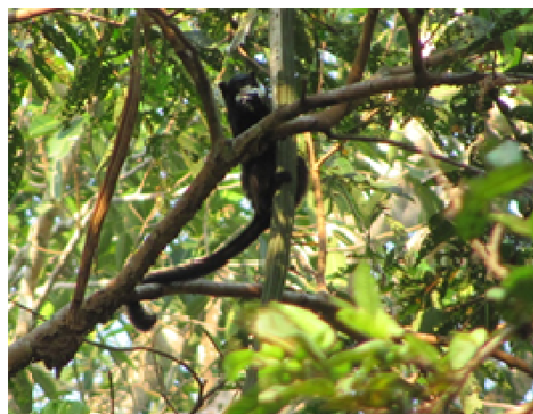
Figura 3. Saguinus mystax en plena actividad alimenticia, observado durante los censos.