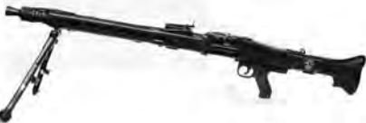
– Ametralladora MG-42