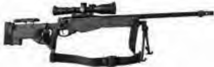
– Fusil de Precisión Accuracy AW