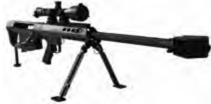
– Fusil de Precisión Barret