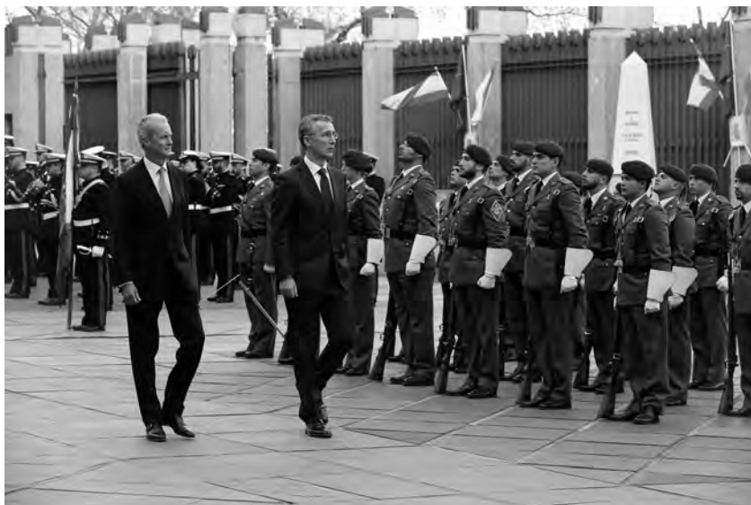
El Ministro de Defensa Pedro Morenés y el Secretario General de la OTAN Jens Stoltenberg pasan revista a una sección del Regimiento de Infantería Inmemorial del Rey n°1. Madrid 12/03/2015.

Además España liderará en 2016 la primera Fuerza de Muy Alta Disponibilidad de la OTAN que contará con efectivos de una brigada española y varios batallones de maniobra de naciones aliadas, constituyéndose así nuestro país en la punta de lanza de la Organización del Atlántico Norte para el próximo año. Esta fuerza estará dirigida desde el Cuartel General Táctico de Alta Disponibilidad de Bétera.