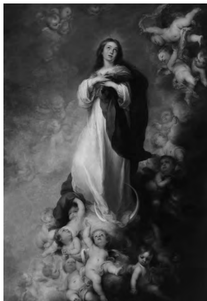
Cuadro de la Virgen Inmaculada Concepción pintado por el artista y pintor Murillo.

Sin embargo, este patronazgo se consolidaría años después. Debido a los acontecimientos anteriormente relatados, el 12 de noviembre de 1892, por Real y Militar Orden de la Reina Regente Doña María Cristina de Habsburgo se declaró Patrona del Arma de Infantería a Nuestra Señora de la Purísima e Inmaculada Concepción.