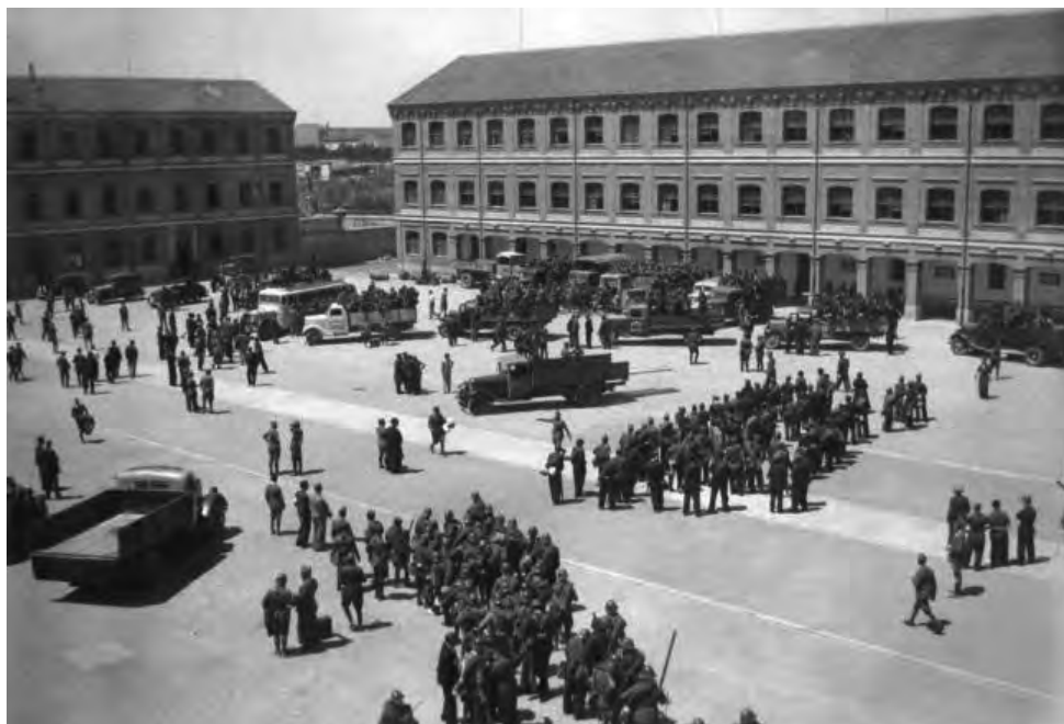
Cuartel Viriato del Regimiento de Infantería Toledo n° 35 de Zamora, disuelto en 1987.