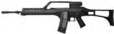
– Fusil de asalto HK G36 E