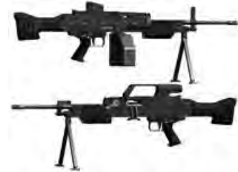
– Ametralladora Ligera HK MG-4