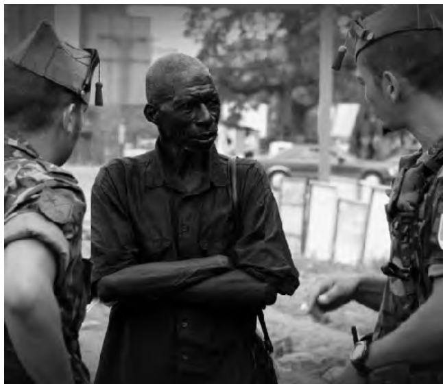
La Legión Española en Misión de Paz.

requerimientos actuales, de forma que sus unidades militares puedan actuar en cualquier escenario internacional con éxito.