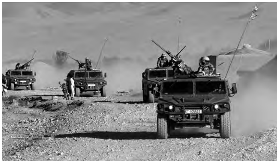
Convoy de vehículos Vamtac en Afganistán.

– Vehículo de Alta Movilidad Táctica URO VAMTAC