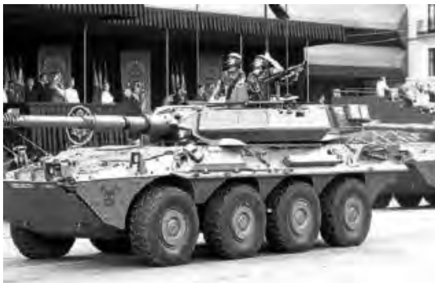
Vehículo Centauro desfilando por el Paseo de la Castellana de Madrid el Día de la Fiesta Nacional de España. 12/10/2006.