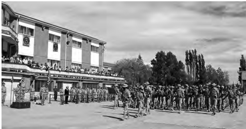
Una compañía del Regimiento de Infantería Garellano 45 de Vitoria se despide antes de partir en Misión de Paz. Año 2011.