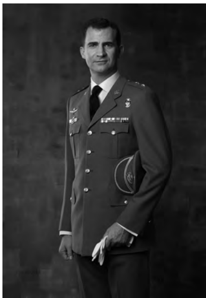
Retrato de S.M. el Rey Felipe VI cuando todavía era Príncipe de Asturias y ostentaba el empleo de Teniente Coronel de Infantería. En los cuellos porta los emblemas de Infantería.