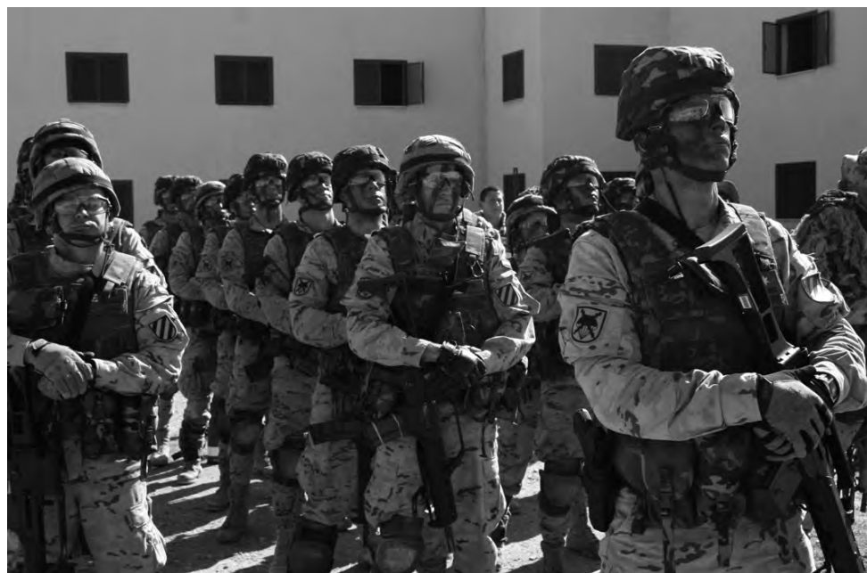
Infantes de la Brigada Paracaidista con uniformidad árida, chaleco antifragmentos y fusil HK G36E. Año 2008.

En un principio lo que se buscaba era impresionar al enemigo, por ello predominaban colores vivos y uniformes muy llamativos que parecían obras de arte llegando a ser en muchas ocasiones incómodos de llevar y de combatir con ellos. Con el paso de los siglos se fue buscando la comodidad y la protección. Actualmente la Infantería viste uniformidad igual que el resto del Ejército de Tierra para actos de representación con los distintivos y emblemas propios del arma. Para misiones internacionales, instrucción y maniobras se utilizan los uniformes que dicten las organizaciones internacionales: uniformidad árida o boscosa.