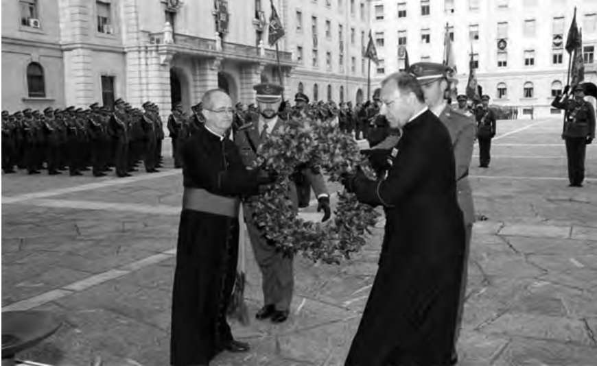
Acto de Homenaje a los que dieron su vida por España. Los Capellanes Castrenses depositan una corona de flores en el patio de Armas de la Academia de Infantería de Toledo.