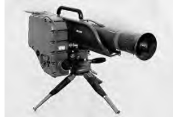
– Sistema de misil contra-carro MILAN