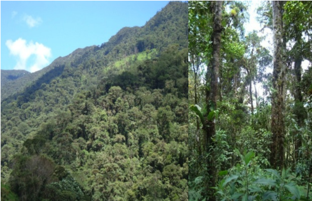
Figura 2. El bosque de la Reserva Numbala, indicando el terreno con pendiente fuerte (izquierda) y el interior del bosque con los árboles grandes de Podocarpaceae (derecha).