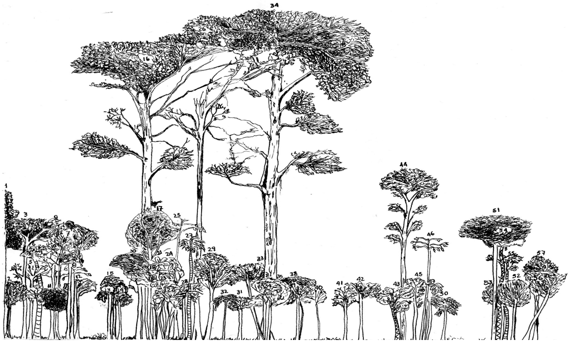
Figura 5. Perfil estructural vertical del bosque nublado de Numbala, en el transecto de 5 x 100 m (dentro de la parcela grande), tomando en cuenta los individuos \geq 5 cm de dap.