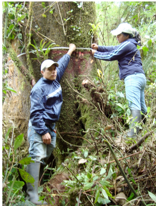
Figura 3. Medición del diámetro de un árbol grande de Retrophyllum rospigliosii en la Reserva Numbala.

Para el inventario florístico y forestal se delimitó y estableció una parcela permanente de una hectárea de bosque (10.000 m 2 ) divididas en 25 subparcelas de 20 x 20 m (400 m 2 ), en cada una se tomó datos de todos los individuos \geq 5 cm de diámetro a la altura del pecho (DAP, altura 130 cm), altura total, coordenadas (x-y) y las características botánicas de las especies (Figura 3). Además del registro de los árboles en la parcela permanente, se registraron los arbustos, herbáceas y epífitas en subparcelas de acuerdo a un diseño anidado de inventario (Lozano y Yaguana, 2009); los datos de las plantas aparte de los árboles no están incluidos en el presente artículo.