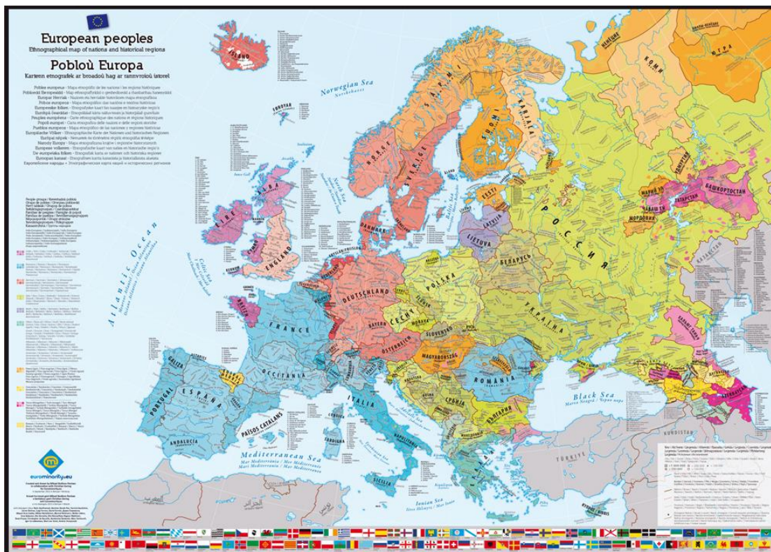
Figura 1. Mapa de los Pueblos de Europa [Mapa] (sf) 11 .

dimensiones antropológicas, históricas, psicológicas, lingüísticas, geográficas y sociológicas del término minoría, la Figura 1 visualiza el mosaico que, a comienzos del siglo XXI, presenta Europa, en contraste con las cartografías oficiales que sobreponen las fronteras nacionales sobre esta pluralidad 10 . En el mapa, las principales familias lingüísticas aparecen representadas en la gama de un mismo color: azul para la familia románica, rojo para la germánica etc.; además cada comunidad está demarcada con líneas más oscuras y asociada a un nombre en lengua local escrito en mayúsculas.