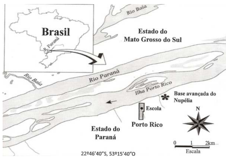
Figura 1. Mapa da região de Porto Rico, Paraná, Brasil