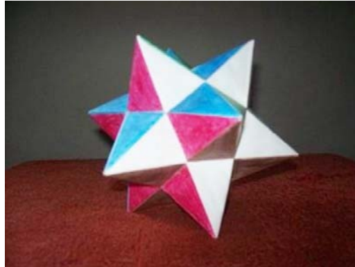
Figura 2. Pequeno dodecaedro estrelado