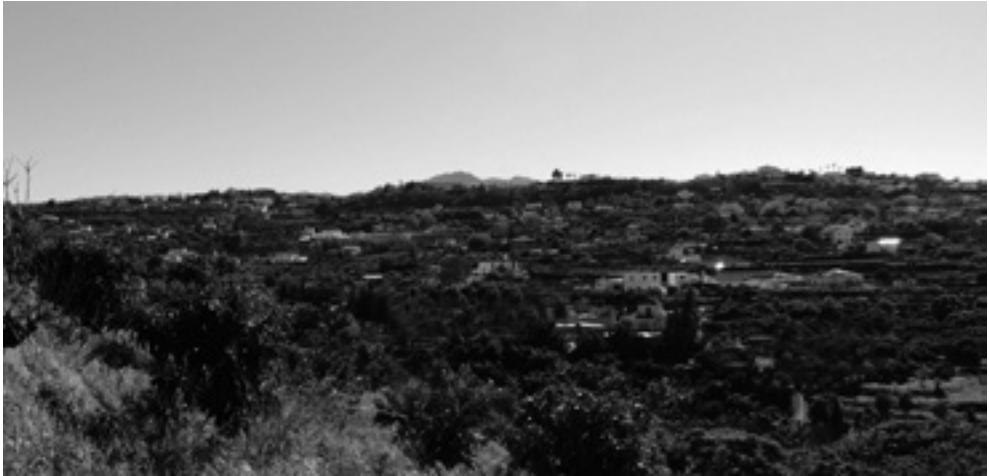
Figura 3. Espacio productivo adyacente al castillo. Huertas del partido del Naranjal y arroyo Cuevas.

Benamaquís era por tanto una aldea fortificada en donde fue necesario el uso de la artillería para su conquista y que en principio tenía unos 300 habitantes. Pero a los 120 varones corresponderían no unas 180 mujeres y niños, sino al menos 460 personas, siendo en realidad unos 600 los habitantes de la villa. Con seguridad, la mayor parte de las mujeres y niños emigraran a lugares más seguros, probablemente a Málaga. Por otro lado aplicando los parámetros todavía no superados de Torres Balbás 6 , correspondería una media de 75 metros cuadrados por casa, teniendo en cuenta los espacios comunes y con una media de 4 habitantes por casa. Eso nos llevaría a considerar un recinto urbano con unas 150 casas (600 habitantes) y unos 11.250 metros cuadrados que se correspondería a su vez a un cuadrado de unos 112 metros de lado. Desconocemos si además