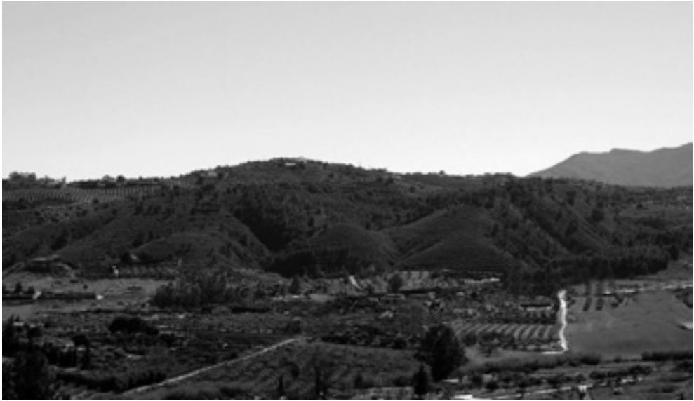
Figura 7. Sierra de Los Ángeles, antiguos montes de Xubic

Otra posible ubicación, tomando en consideración criterios topográficos y ecológicos, habría que buscarla en el territorio comprendido por encima de los Montecillos, en la zona de Los Ángeles, donde algunas de las posibles localizaciones están ocupadas por viviendas particulares, aunque no se observa cerámica en los alrededores. Otras alturas localizadas en las zonas de El Rincón y Los Ángeles y que no están excesivamente arrasadas por las construcciones de “fin de semana” tampoco muestran restos cerámicos apreciables, ni por supuesto estructurales.