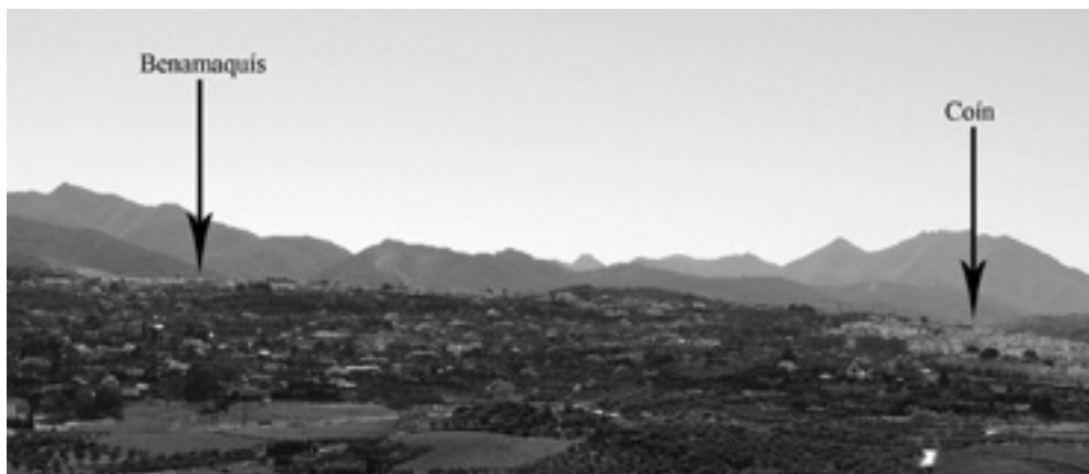
Figura 4. Vista panorámica del territorio correspondiente a Benamaquís.