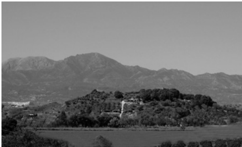
Figura 6. Cerro de las Lombardas, entre los términos de Coín, Benamaquís y Pereila.

cos que pongan en evidencia su primitivo emplazamiento. Desde el punto de vista arqueológico, ya Madoz nos indica la existencia de restos en Los Llanos y en los alrededores del Cerro Carranque (Cerro Derrumbaderos en los mapas), popularmente conocido como “Cerro de las Lombardas” pues se dice que se encuentran en él bolaños, al parecer porque desde este cerro se bombardeó Coín en el momento de su conquista. La lombarda era una pieza que se utilizaría en el asedio de Coín, pero el alcance es de unos 1.200 metros y para que fuera eficaz, tenía que dispararse entre 100 y 200 metros del objetivo y el cerro está a una distancia bastante superior. Por otro lado no es ni siquiera visible la villa desde su mayor altura, por lo que no es probable que se bombardease desde ese lugar. El hallazgo de bolaños podría explicarse porque posiblemente se fabricaran allí, ya que en su suelo (sin ser rocoso) afloran rocas intermitentemente. De