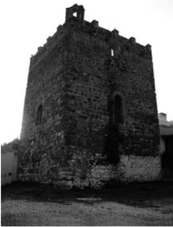
Figura 5. Torre de alquería de Hurique (TM de Alhaurín).

piedras de las lombardas a partir con lo de Barrionuevo (Pereila) y acaba en la calera”.