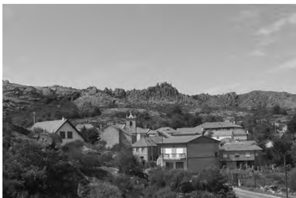
Castelo do Castro Leboreiro