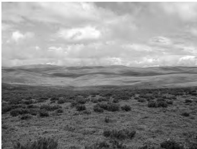
Planalto do Leboreiro (1.300 mts)

Lonxe, cara ao nacente, e ben visible na distancia dende o adarve da torre, péchase o círculo de montañas no alto do San Cibrao do Monte Calvo (914 mts), testemuña residual e proxección final xunto