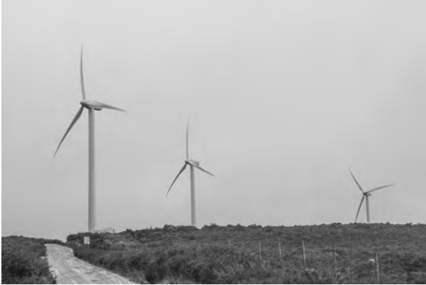
Montes de Cexo no chanzo dos 1.000 mts

Chama a atención que as xentes da antigüidade tiveran tan presente a existencia desta colosal superestrutura que comeza aló nas terras finais do Planalto portugués e da Serra do Leboreiro, terras pecuarias onde pastaban no Medievo milleiros de reses, que salvando todos os topónimos intermedios (porque estamos seguros que moitos deles xa existían), superando os picoutos e as morfoloxías residuais dos chanzos inferiores, consideraran que ese último nivel onde cos anos se levantaría castelo e mosteiro, onde os pais de san Rosendo xa tiñan casa en Vilanova antes de se construír o mosteiro de Celanova, estaba “so” o monte Leboreiro.