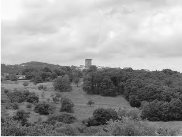
A torre de Vilanova con Castromao ao fondo