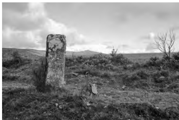
Marco das catro cruces no chanzo dos 1.000 mts