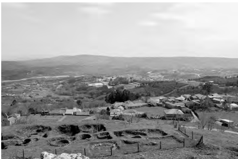
Castromao co Monte Calvo ao fondo

Pois ben, na nosa área, neste gran territorio que espalla dende o castelo de Vilanova ata a fronteira co Castro Laboreiro, detectamos claramente catro grandes chanzos ou niveis de aplanamento que configuran con bastante precisión o noso país pequeno, unha enorme escaleira que nos leva dende os ceos atolados das altas e frías cumieiras da Raia, a 1.300 metros de altitude, ata as veigas feraces e mimosas do río Sorga a menos de 400 metros sobre o nivel do mar. O primeiro deles é a inmensa penechira lusa que naquel pais chaman Planalto, terra de mámoas e vacas libertas, de trollos e turbeiras de gran valor ecolóxico, onde destaca despuntando no seu reborde final ese asomo pétreo da Penagache, a 1.225 metros de altitude. Baixando polas abas da Serra do Leboreiro acadamos un segundo chanzo que nos deixa exactamente aos 1.000 mts, no Outeiro de Augas, e logo nos Montes de Cexo que collen os ventos que agora aproveitan os de Iberdola, e onde destaca a Penadeda cos seus 1.023 mts. Descendemos de novo polas abas do Monte Oural para chegar ao terceiro nivel achanzado que nos leva aos 800 metros, na gran Chaira de Amoroce, das lagoas onde beben as