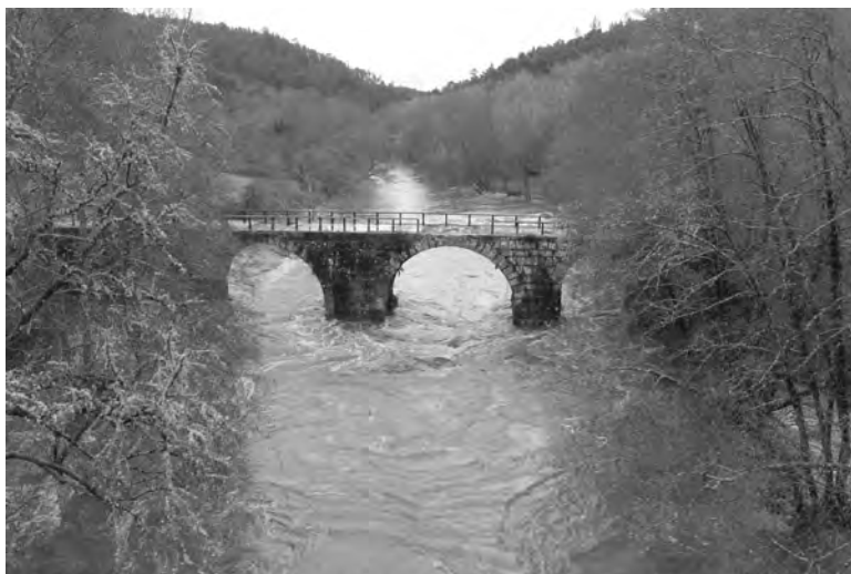
Ponte romana de Freixo (Río Arnoia)

O territorio onde empraza Vilanova e tamén Celanova é o máis agarimado e recuado de todo o val, unha pequena plataforma en leve pendente cara ao nacente encanastrada e cercada polo Norte pola Serra de Vilanova, polo Sur polo Monte da Casa da Neve, e polo Oeste polos declives arrasados do último chanzo xeolóxico onde instala o microcosmos de Amoroce, o Castromao e San Xulián da Gandarela, a cuberto das nordestías e das fronteas oceánicas que varren violentamente a Chaira. Ademais a valiña de Vilanova instala no interfluvio feraz que delimitan o regato de Castromao fronte A Costa e a pronunciada entalladura do regato da Gandarela fronte á Serra (no punto en que contactan os nosos granitos cos xistos de Freixo), unhas cincuenta hectáreas de agras nutritivas que daban de comer á xente daquel burgo medieval, a unha distancia prudente do río principal para fuxir das brétemas, das xeadas dos fondos de val e das malsás humidades, pero non demasiado lonxe como para non aproveitar a hidromorfía dos solos onde situar os prados. E por último tamén hai que salientar que estes dous humildes regatos, no seu discorrer paralelo cara ao Sorga, cinguiaron e moldearon “ neste val do medio e medio ” un relevo residual, un esporón pétreo onde hoxe chanta o castelo e antes un castro seguramente;