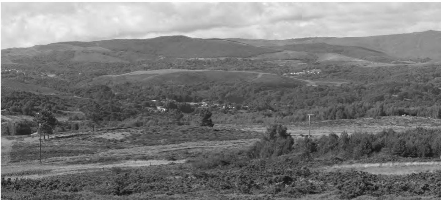
Chanzo dos 800 mts, coa Serra do Leboreiro ao fondo

Se hai un monte nese círculo de montañas que chama a atención, pola súa proximidade e dimensión, é o monte da Serra, que os da Gandarela chaman de San Marcos, e os de Vilanova sinxelamente A Serra ou por posesión, A Serra de Vilanova. Pois ben, ese monte, esa muralla que corta e acouta o mundo polos aires do Norte, que impide cos seus seiscientos metros de altitude que a nosa ollada alcance as terras baixas do Arnoia a tan só tres quilómetros de distancia, que nos protexe das friaxes e das frieiras, é o remate final dun mundo que aquí esborralla definitivamente, un mundo que nace na fronteira con Portugal, a dezaseis quilómetros de distancia; un mundo que non vemos e que tan só podemos intuír