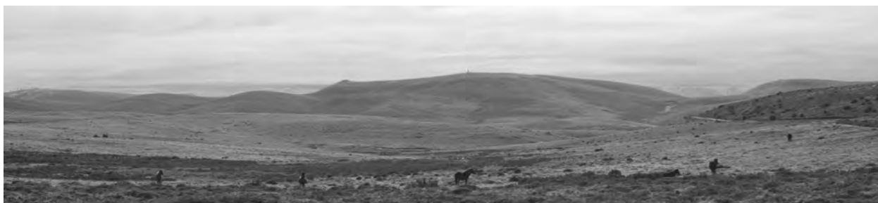
Planalto aos 1.300 mts coa Pena de Anamán ao fondo

Algúns expertos nas cousas da xeoloxía, da tectónica, das forzas brutais que moven e fan tremer o planeta, explican que a Nosa Terra, a primeira terra firme emerxida das augas da península ibérica e xa que logo a máis vella, está configurada a xeito