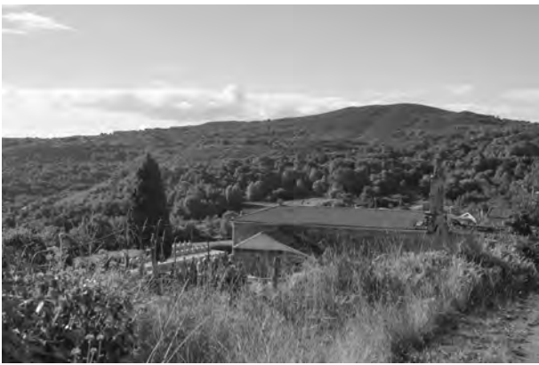
Casa da Neve

Pois ben, imos logo examinar ese círculo de montañas, ese val tan verde e florido onde chantan as brancas casas da vila de Vilanova, vila de grande sona, e da que asoma tan antiga e magnífica torre.