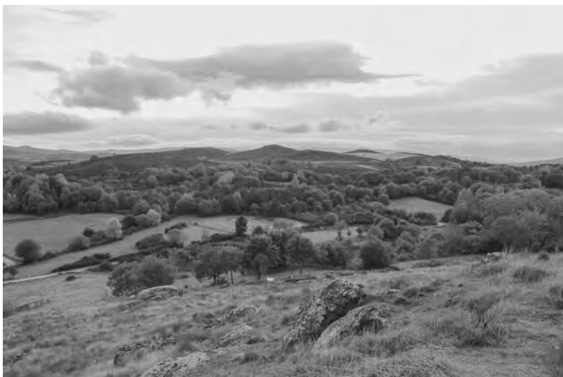
Chaira de Amoroce

de enorme escaleira cuxos chanzos levantaron ou afundiron pola enorme presión dos magmas que flúen e gurgullan a milleiros de graos nas entrañas do planeta. E din que mentres uns bloques soerguían outros afundían, xerando dese xeito grandes superficies achanzadas que chaman superficies fundamentais, plataformas ou penechairs sobre as que o tempo infinito das idades xeolóxicas traballou incansable para modelar e fabricar as paisaxes que hoxe nos son tan familiares.