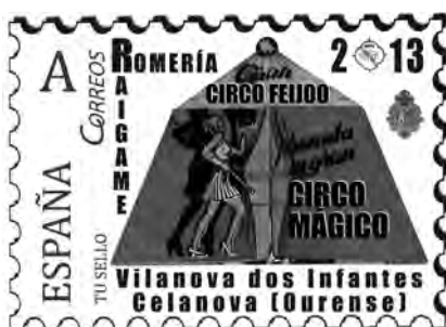
Circo Feijoo Data de presentación: 17/5/2013

Outra rama dos Feijoo é a que deriva da irmá de Secundino, Blasinda que casou en Vilanova con