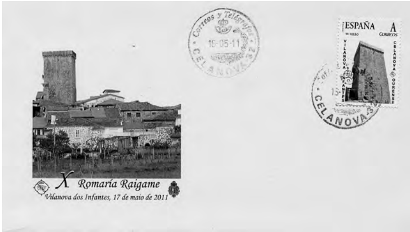
Sobre ilustrado e tarxeta máxima conmemorativas