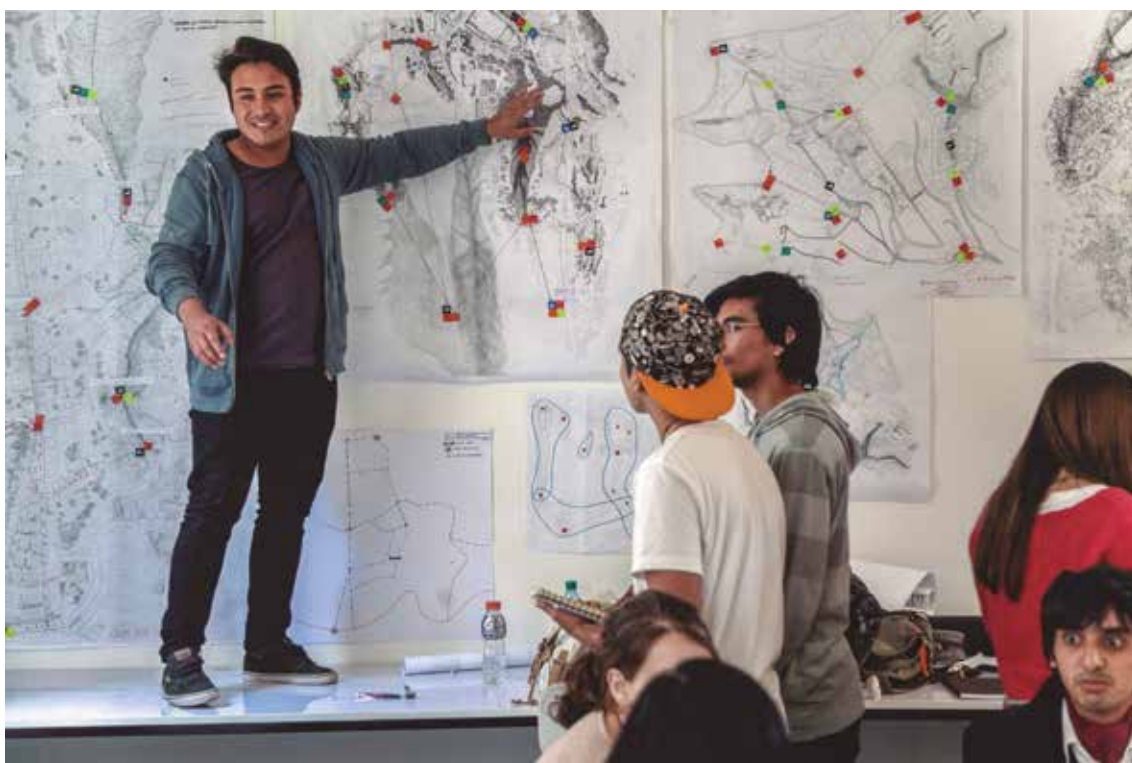
Figura 6 Entrega taller integrado, 2015. Escuela de Arquitectura de la Universidad de Valparaíso, Chile.