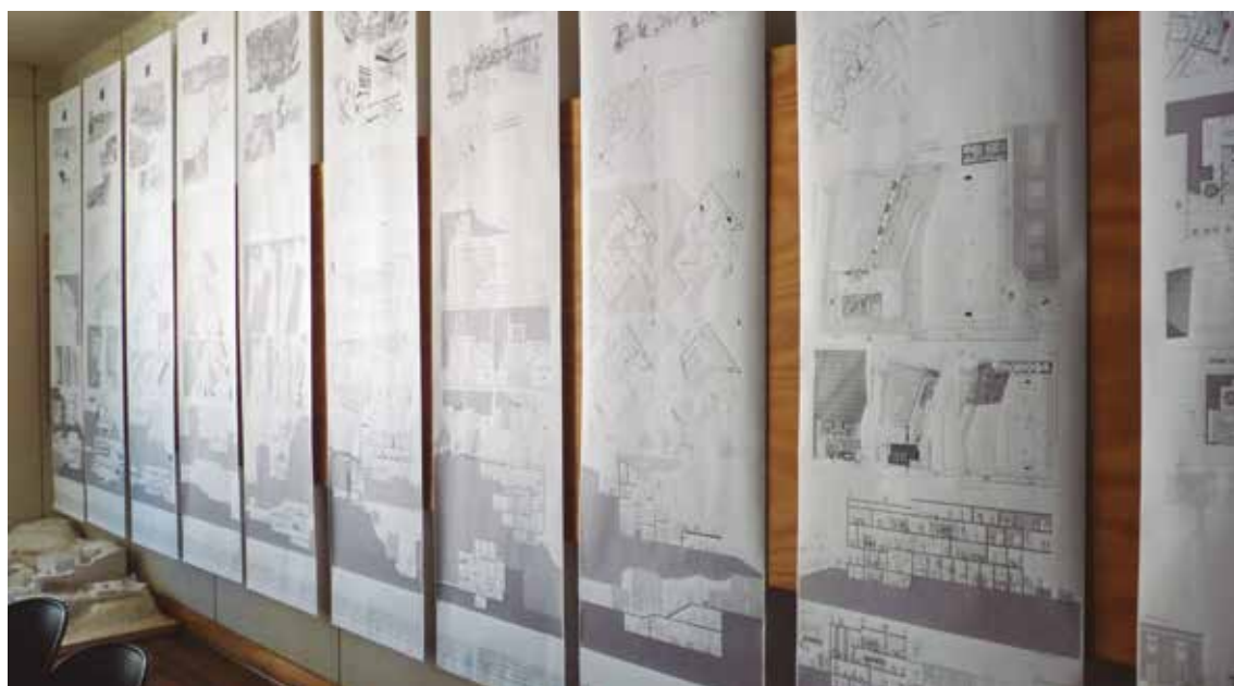
Figura 1 Entrega taller, 2015. Escuela de Arquitectura de la Universidad de Valparaíso, Chile.

Basar, entonces, la evaluación del proyecto en cuantificaciones rigurosas sería una quimera porque: (a) los conocimientos y habilidades inherentes al proyecto constituyen una unidad que no puede segregarse ni examinarse de forma autónoma; (b) su aprendizaje no es lineal, por tanto, las valoraciones cuantitativas secuenciales perjudican a quienes tardan más en aprender y a quienes lo consiguen por derroteros no convencionales (Arentsen, 2009:10); y (c) las calificaciones numéricas,