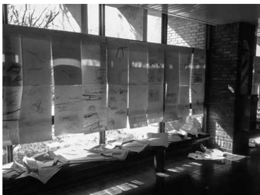
Figura 2 Entrega taller integrado primer año, 2015. Escuela de Arquitectura de la Universidad de Valparaíso, Chile.