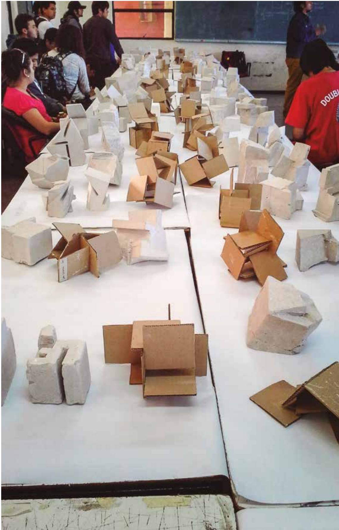
Figura 0 Entrega Taller Integrado primer año, 2013. Escuela de Arquitectura de la Universidad de Valparaíso, Chile.