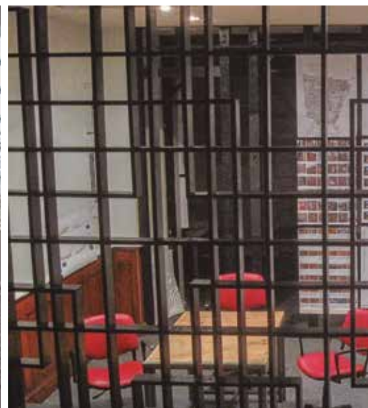
Figura 5 (a, b y c) Entrega taller, 2013 (a y b) y 2009 (c). Escuela de Arquitectura de la Universidad de Valparaíso, Chile.

Método. Evaluar las estrategias y procedimientos utilizados para resolver los problemas (ejercicios) planteados, así como organizar el trabajo dentro del tiempo disponible. Fundamental es aquí el “criterio de consistencia”, pues permite advertir la adecuación de los recursos empleados en las respuestas dadas. Siempre es preferible tomar conciencia de posibles inconsistencias evaluativas, que estar dominados, inadvertidamente, en nuestras valoraciones por una u otra visión subjetiva del quehacer académico.