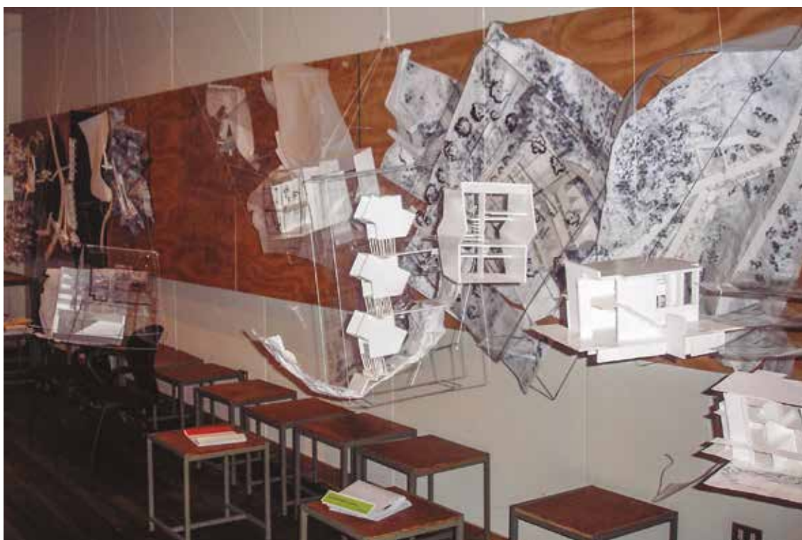
Figura 7 Entrega taller, 2006. Escuela de Arquitectura de la Universidad de Valparaíso, Chile. Fuente: Carlos Lara