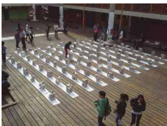
Figura 3 Torres de yeso. Taller integrado primer año 2013. Escuela de Arquitectura de la Universidad de Valparaíso, Chile.