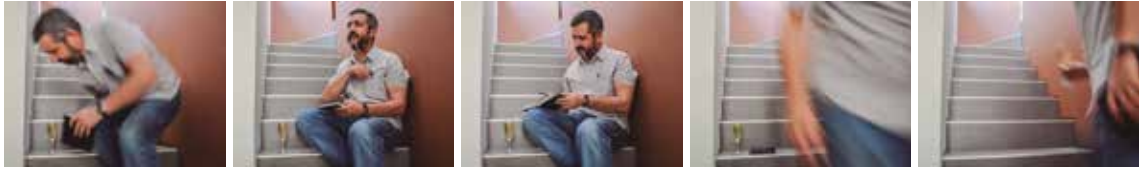
Secuencia: Placeres cotidianos