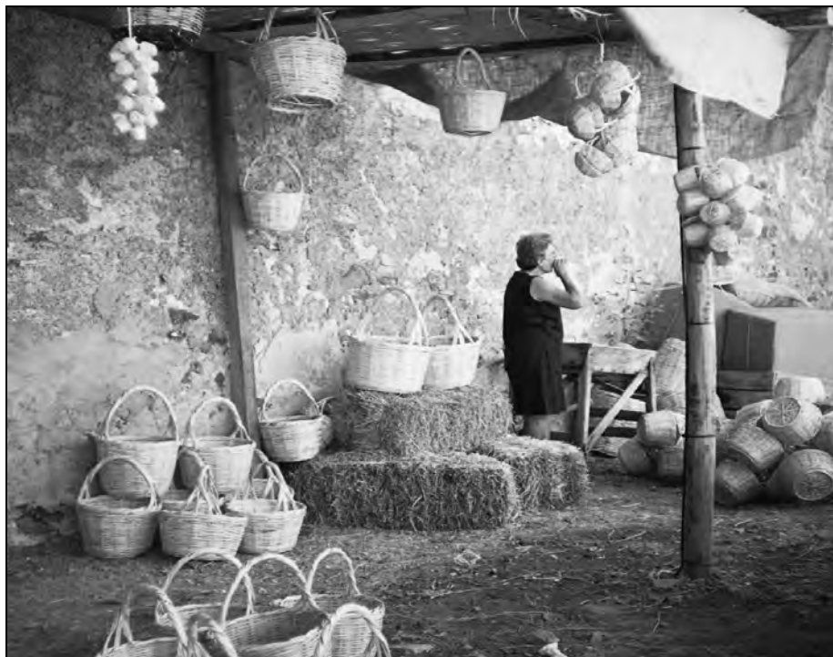
Figura 3. Diversidad de cestos hechos de caña en la provincia de Algarve (la fotografía es propia).

ser útiles para entablillar los huesos rotos del ganado (Fajarardo et al. 2000). En la Sierra Magina (Jaén) y en la Manchuela (Albacete) los adolescentes hacían pipas con las cañas (Mesa 1995 y Fajardo et al. 2000).