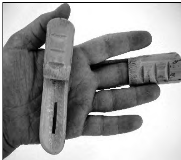
Figura 2. Los canudos hechos de caña, sirven para proteger los dedos de los segadores durante el corte del cereal.

Los 42 informantes han manifestado que las cañas se utilizan para fabricar instrumentos musicales rudimentarios, juguetes para los niños y por otro lado, son de gran utilidad en la agricultura. En este último caso, se hacen cercas con caña viva o seca y también los tallos secos sirven de soporte a las plantas que necesitan guiarse, como habichuelas, tomates, calabazas, judías, entre otras.