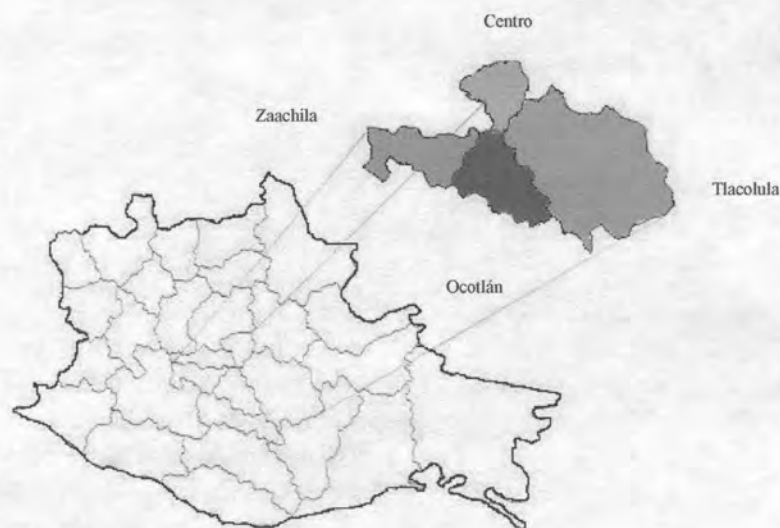
Figura 1. Región de los Valles Centrales del Estado de Oaxaca, México.

En los distritos de los Valles Centrales de Oaxaca el día de plaza se realiza una vez por semana. Para este estudio se consideraron los mercados de los municipios de Ocotlán, Tlacolula, Central de Abastos y Zaachila (Figura 1) por ser en donde existe la mayor afluencia de productores, intermediarios y consumidores de diversos productos, entre ellos, los huevos de las gallinas criollas.