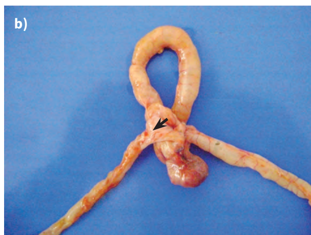
a) Dilatación de estómago e intestino (a), cambios de coloración en el ciego (b) y adherencias intestinales a pared abdominal (c). b) Cambios de coloración en la región ileocecal y adherencia de intestino delgado al ciego (flecha).