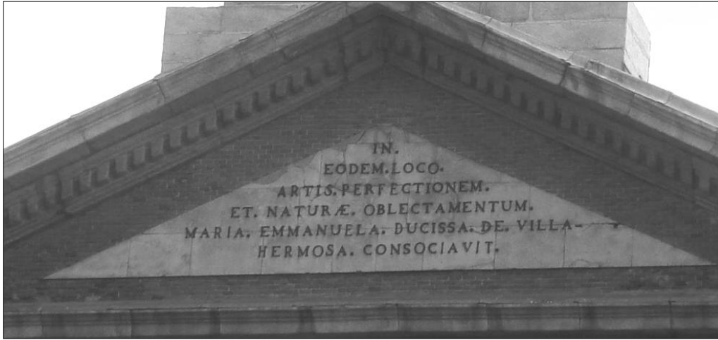
Frontón del Palacio Villahermosa, Madrid 1

La inscripción se encuentra en la placa triangular adosada en el frontón de la fachada principal del Palacio de Villahermosa, en el número 8 del paseo del Prado. Placa de mármol cuya conservación es muy buena, al igual que la escritura, cuya lectura se realiza sin dificultad. La inscripción se dispone en seis líneas con una buena organización, se alinea en el centro, adaptándose así a la forma del soporte y campo escriptorio.