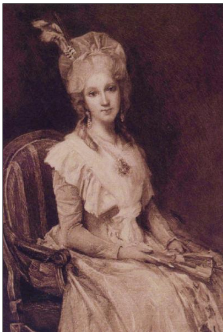
Grabado de doña María Manuela de Pignatelli, duquesa de Villahermosa 72

“[...] llorándola su hijo, llorándola los jesuitas todos; llorándola también los infinitos pobres que vivían de sus limosnas, y Madrid entero, que conocía sus virtudes, se asoció el duelo que produjo su muerte apenas fue conocida [...] La cripta del Monasterio de Veruela recibió sus cenizas, sin que pomposa inscripción, ni ampuloso elogio, ni larga lista de títulos revelen al que la visita de quién son los restos que allí se guardan; silencio muy conforme con la modestia verdaderamente cristiana de la que, habiendo nacido en excelsa cuna, tuvo por norma constante de su vida el antiguo lema de la casa de su marido: virtus vera Habilitas (La virtud es la verdadera nobleza) 71 .