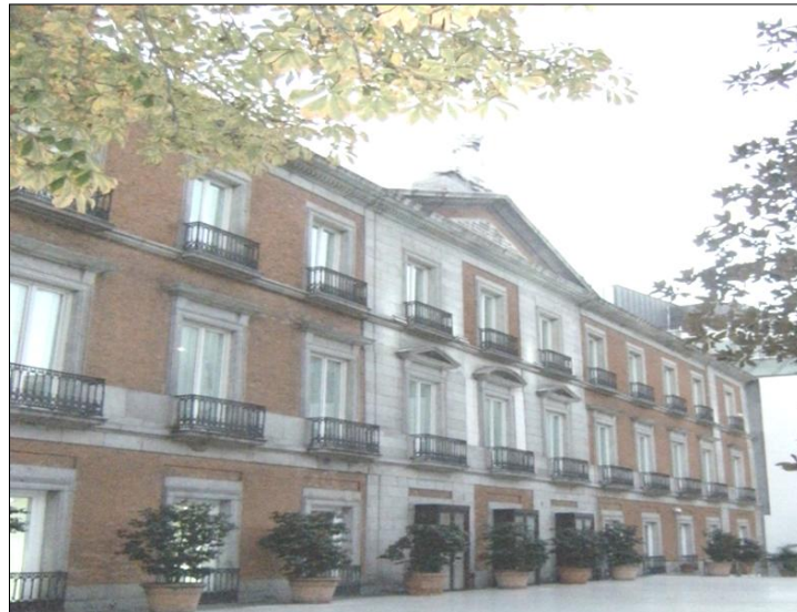
Museo Thyssen-Bornemisza en el siglo XXI 70

El palacio, junto con sus jardines, cumplió varias funciones a lo largo de los siglos XIX y XX: en 1846 alojó el Liceo Artístico y Literario de Madrid en la planta principal; a finales de esta centuria, la marquesa de Esquilache inauguró uno de los más importantes salones de la época, herederos de sus tertulias, que se habían originado en el siglo XVIII 69 .