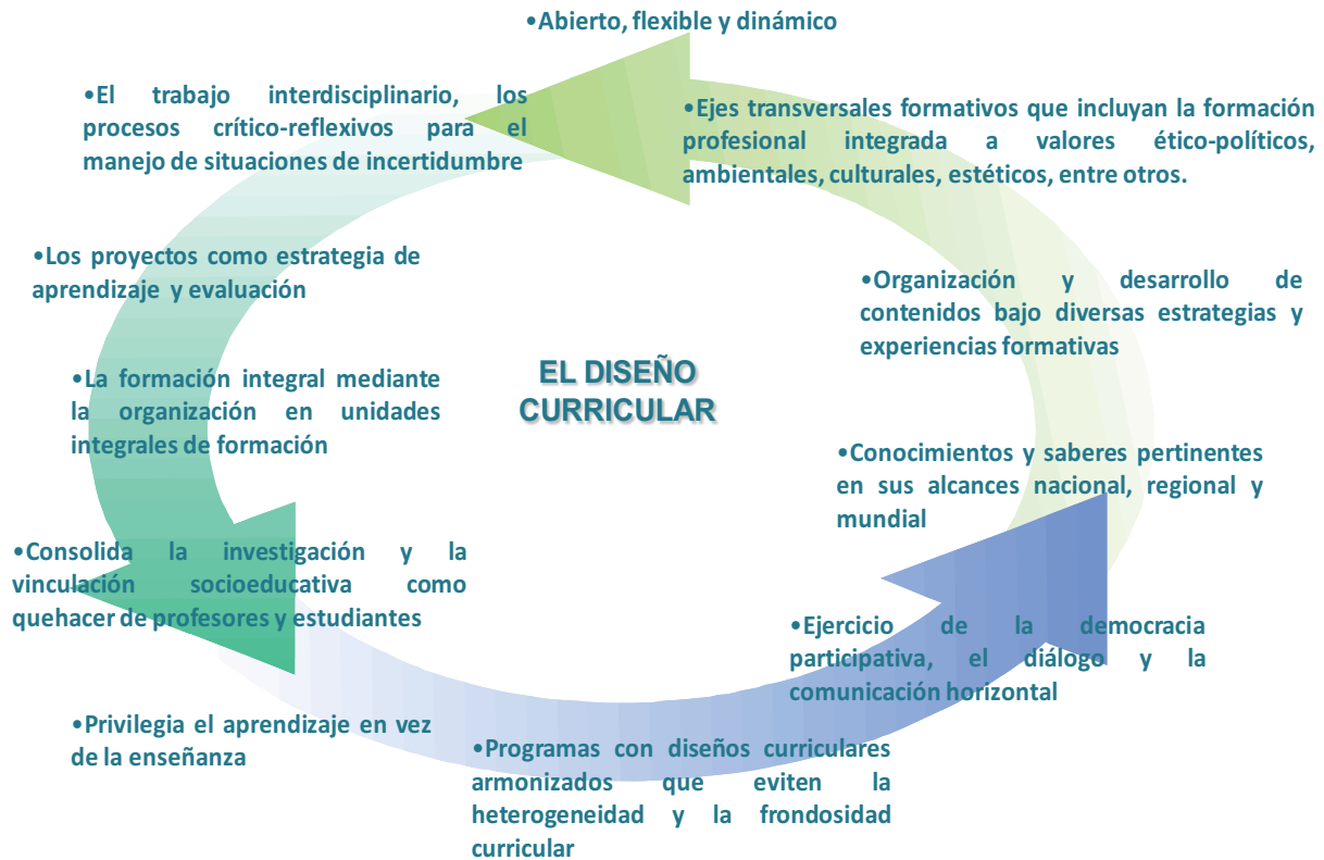
Gráfico 3 Diseño curricular de los programas nacionales de formación