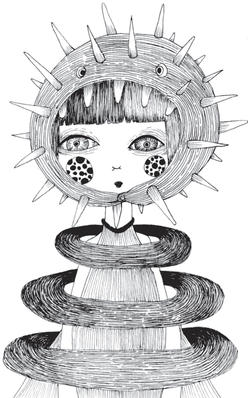
De la serie Inocencias Trastocadas Estilógrafo sobre papel, mixed media Dimensiones variables 2015 Rionegro, Antioquia