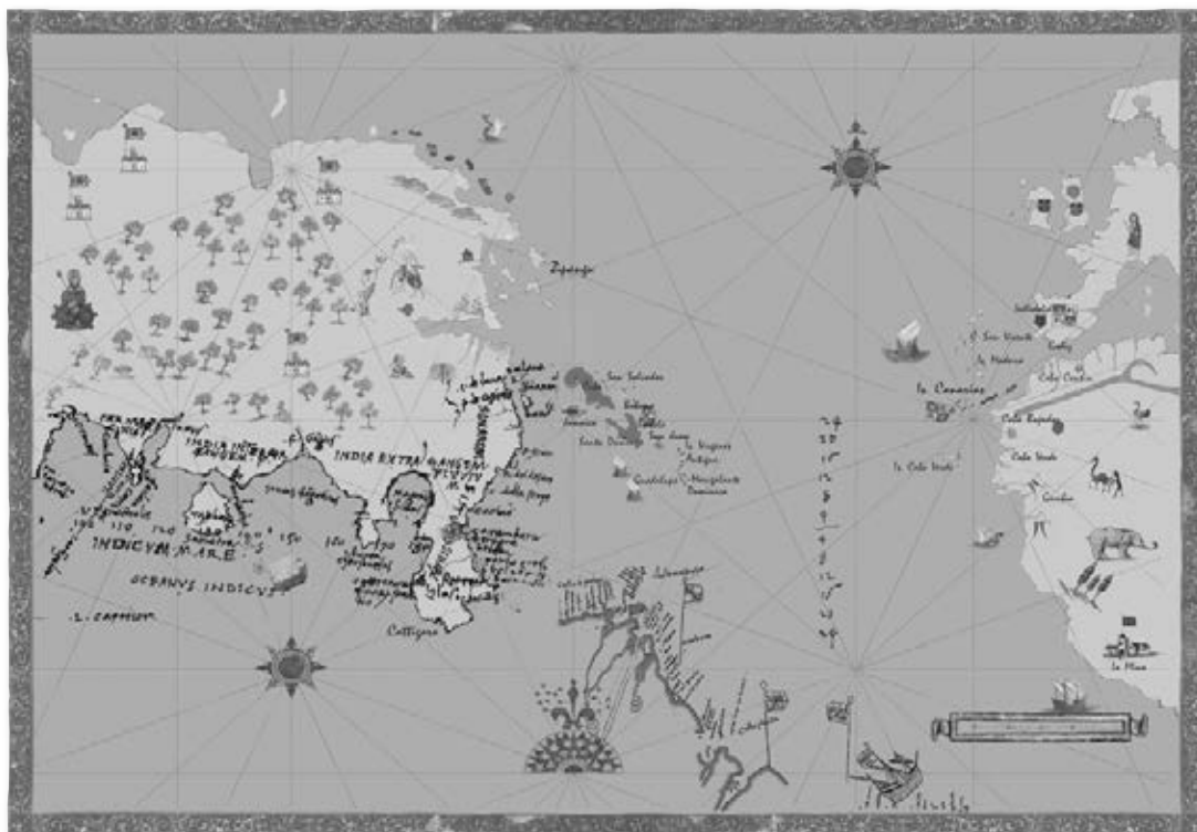
Reproducción realizada por el SIDC en la que se aprecia la teoría de Cristóbal Colón sobre su recorrido y la costa real descubierta