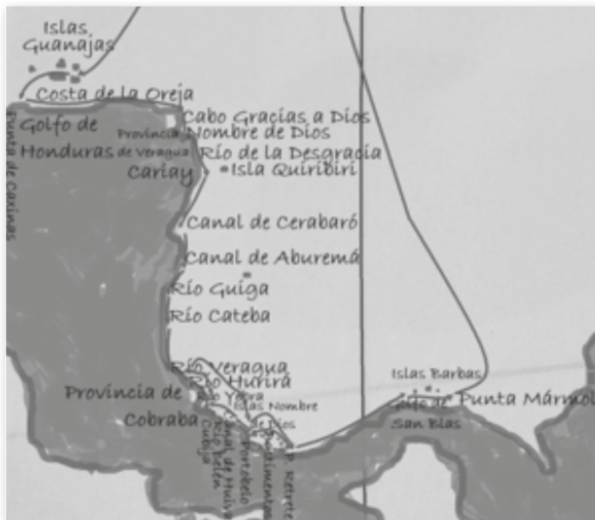
Reproducción de la ruta según Hernando Colón