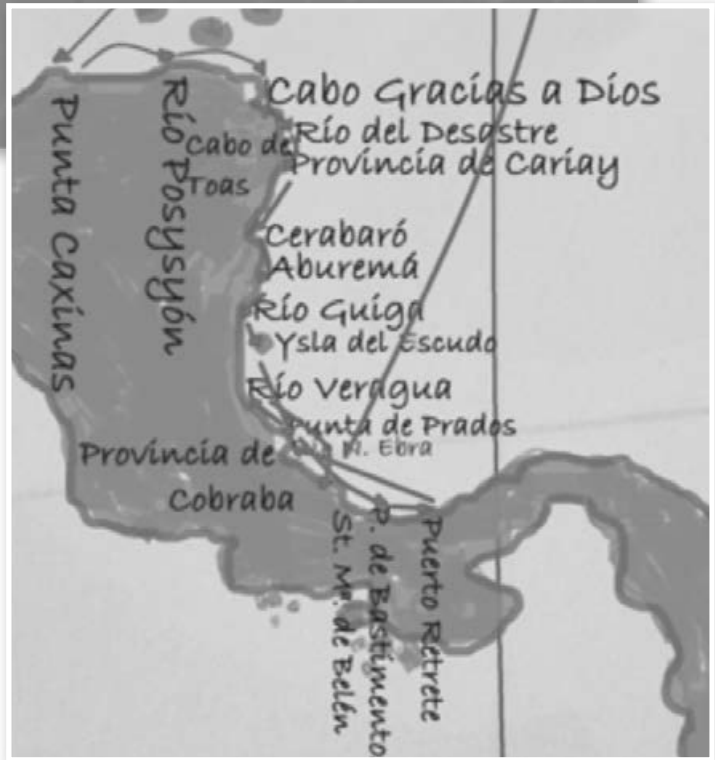
Reproducción de la ruta según la información de los Porras