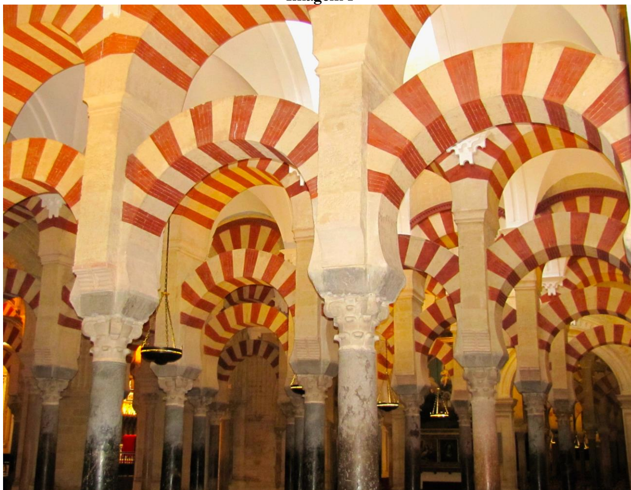
Arcos em ferradura no interior da Grande Mesquita de Córdoba (foto nossa).

Diversos historiadores da arte e da arquitetura islâmica já discutiram a questão da imponência dos arcos e o impacto visual por eles causado. São comuns as referências aos aquedutos romanos existentes na região, o que poderia ter inspirado os arquitetos muçulmanos a projetar uma obra de igual força. No entanto, considerando-se que as colunas disponíveis e reaproveitadas dos espólios, no caso da Península Ibérica, não eram de grande altura, e dado o possível interesse do emir ‘Abd al-‘Rahmân I na construção e uma obra significativa para um emirado que se mostrava muito bem-