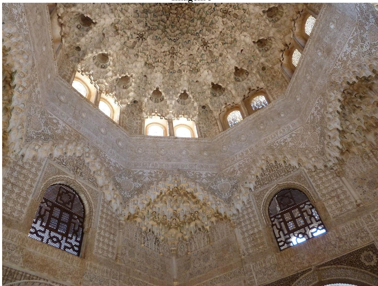
Muqarnas da Sala das Duas Irmãs, Palácio dos Leões.