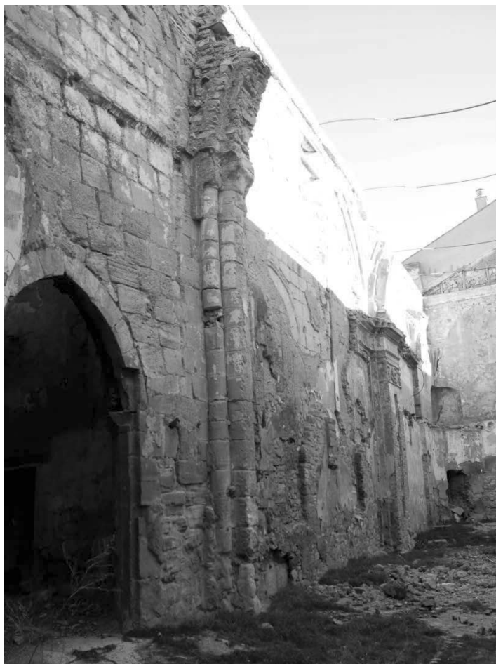
Fig. 3. Interior del muro norte. Último tercio del siglo XII con reformas posteriores.

Visto desde fuera, el edificio debía ser una potente obra de dorada sillería arenisca, con contrafuertes en los paramentos laterales que neutralizaban las cargas de los arcos fajones de la nave y del presbiterio. Dichos estribos articulaban los muros norte y sur en tres sectores, en los que se abrían sendos accesos (segundo tramo) y vanos (tercero y, quizá, primero). El presbiterio repetía ventanales de idéntica factura, mientras que el hemiciclo absidial se dividía mediante cuatro contrafuertes en tres paños, ciegos los laterales y el central perforado con otro vano abocinado. Éste era casi idéntico, según las descripciones antiguas, al del vecino templo de Santa Clara y, por ende, a los