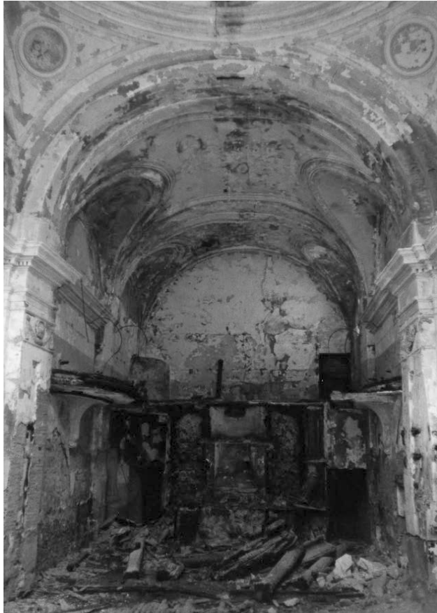
Fig. 7. Interior de la cabecera antes de su derrumbe. 1819.

sector, se aprecia un lienzo reconstruido con sillares que evidencian algunos desperfectos posiblemente ocasionados por un desplome.