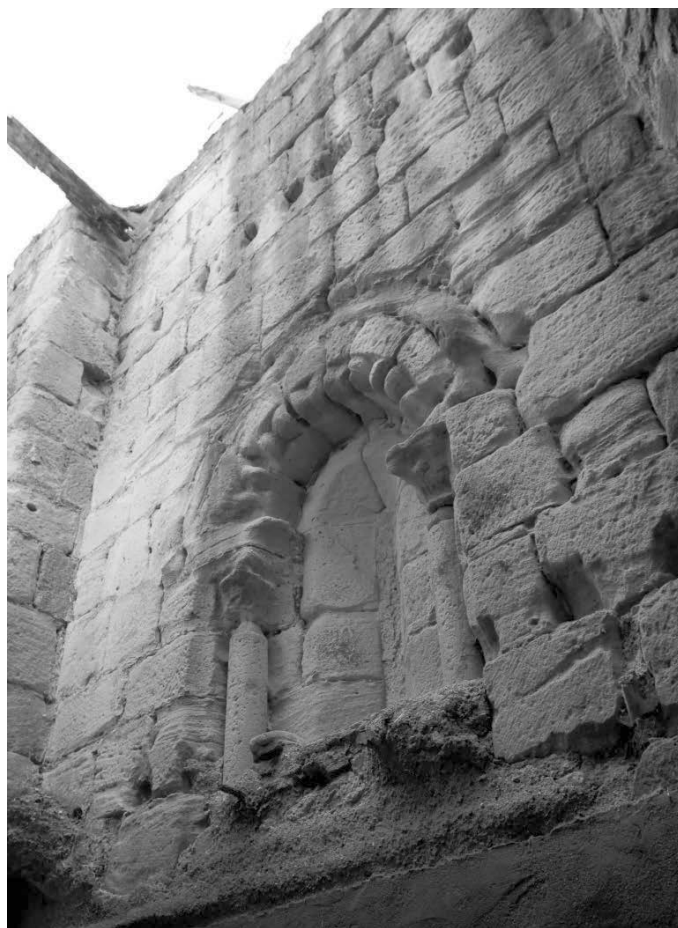
Fig. 5. Muro del tercer tramo norte. Último tercio del siglo XII.

El tramo recto de la cabecera románica no sufrió la misma suerte que el remate semicircular de la misma, y sus muros se reaprovecharon y enmascararon bajo la obra neoclásica. Los elementos conservados permiten saber que tanto en el lado del Evangelio como en el de la Epístola se abrían sendos vanos de características muy similares. Como se puede observar en el muro sur, hacia el interior de la iglesia formaban un gran arco de medio punto muy sencillo, cuya luz se estrechaba de manera muy acusada hacia fuera. Su cara exterior se resolvía de un modo mucho más ornamental, con bellos ventanales de 2'5 metros de alto por 1'5 de ancho. Aunque el del mediodía fue tabicado al construirse la sacristía, el del lado norte aún se conserva en un estado aceptable, y cuenta con molduras de puntas de diamante en la chambrana y las jambas, rosca animada con florones carnosos y una pareja de capiteles con hojas de las que penden frutos esféricos, y que descansan sobre estilizados fustes y desgastadas basas.