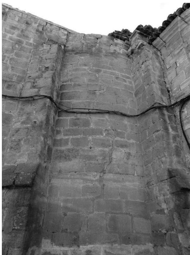
Fig. 4. Vestigios del ábside románico. Último tercio del siglo XII.

El hemiciclo sólo conserva los referidos cimientos y un exiguo fragmento del arranque septentrional, cortado de forma abrupta por la cabecera del siglo XIX. Este lienzo está construido a base de buen sillar escuadrado, queda enmarcado entre dos contrafuertes y presenta un ligero recrecimiento que fue efectuado para igualar su altura con la de la capilla mayor neoclásica. La cornisa románica se situaba un poco más baja, como así lo demuestra el canecillo a base de modillones de rollo que aún se conserva in situ . Por desgracia, al no existir ninguno más, resulta imposible saber si esa decoración se repetía en todos los canes restantes, como sucede en Santa Clara, o si por el contrario había una mayor variedad temática (fig. 4).