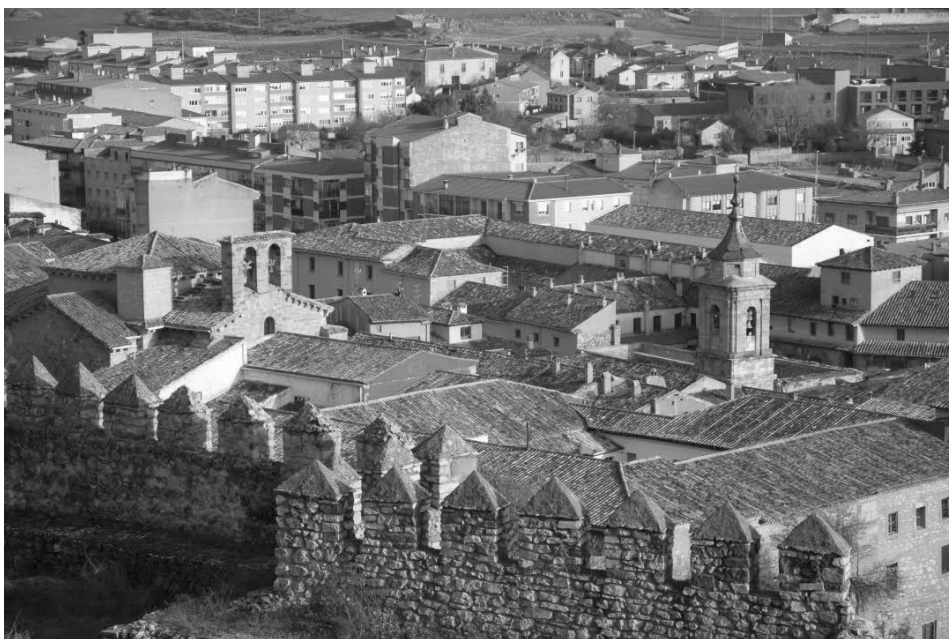
Fig. 1. Iglesias de San Martín (derecha) y Santa Clara (izquierda). Vista desde el recinto del castillo. Molina de Aragón (Guadalajara).