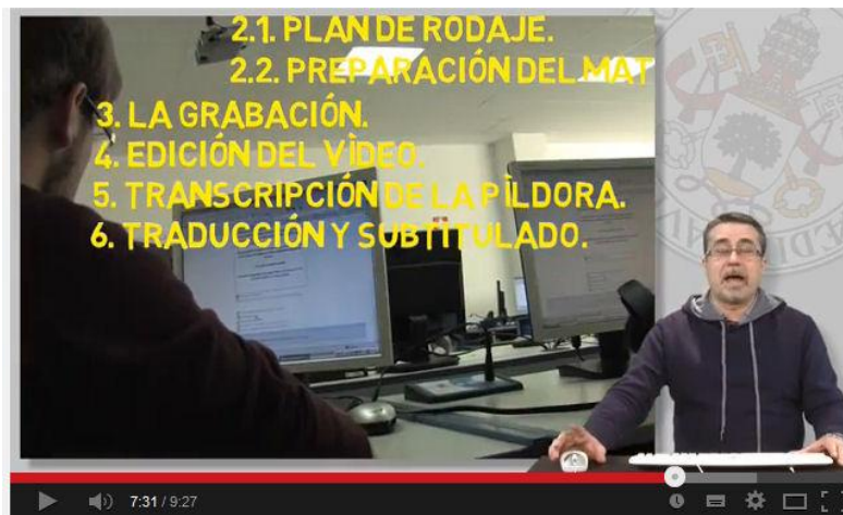
Ilustración 3: Fotograma de la micropíldora «Cómo elaborar una píldora de conocimiento» (Corell 2013)

La elaboración de estas píldoras de aprendizaje (o píldoras de conocimiento) tiene unas fases claramente establecidas: elección del tema de la píldora o serie, la presentación (diseño del plan de rodaje, preparación del material gráfico que ilustre el discurso, etc.), la grabación en plató, la edición del vídeo por parte de los profesionales del Servicio de Medios Audiovisuales, la transcripción de la píldora a texto, la traducción y subtítulo de las píldoras y la difusión de de las mismas por diversos medios de la intranet de la Universidad y de Internet.