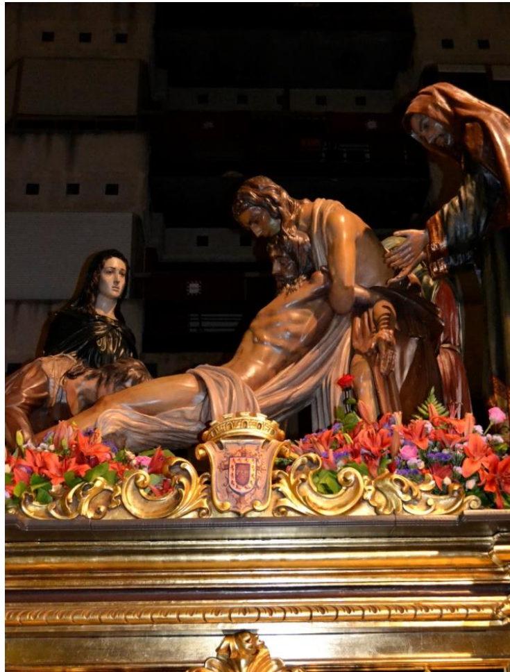
Visión conjunta del misterio ubetense.