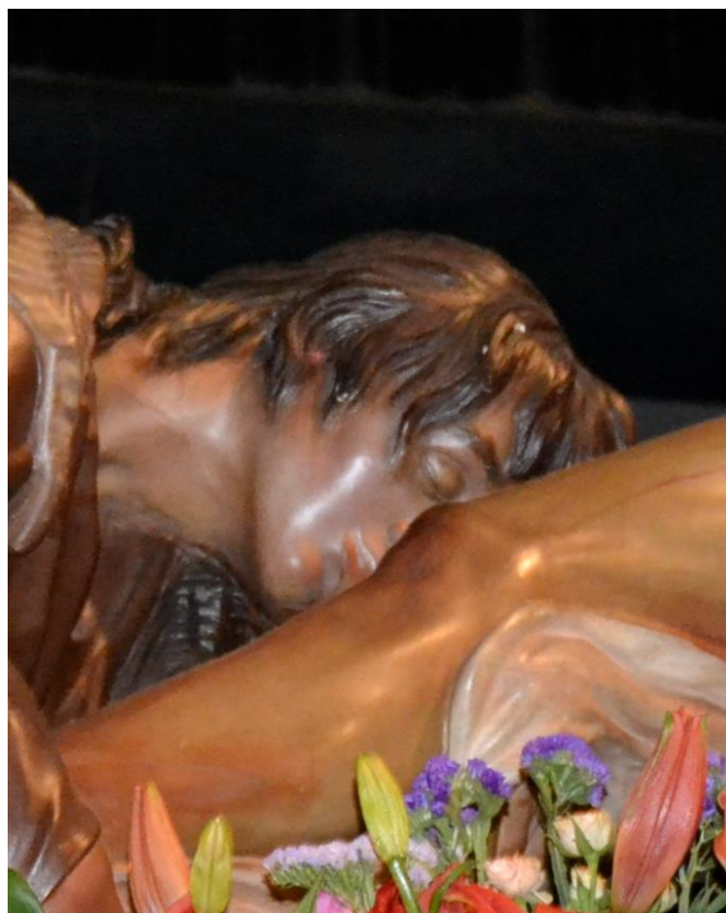
Primer plano de la Magdalena asexual de Úbeda.