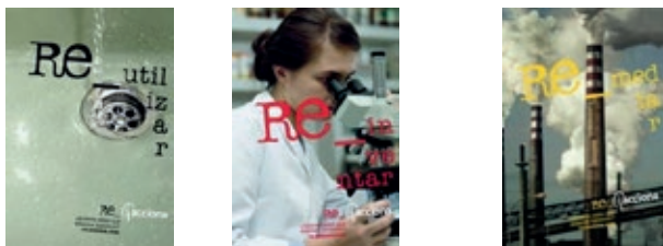
Figura 6. El Reto de Pilar

La campaña es una estrategia destinada a reforzar la apuesta sostenible de sus actividades, y además, involucrar a la sociedad en los cambios que se están viviendo y que exigen a las empresas más responsabilidad. La estrategia de Re_Acciona abre dos interesantes frentes, por un lado muestra la necesidad imperiosa de crear proyectos para el desarrollo sostenible; y por otro convierte esta postura en un reto para el resto de la sociedad, haciendo que ésta se sienta implicada con su trascendental aportación en la construcción de ese futuro y se sienta llevada a la acción.