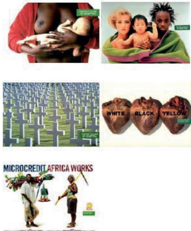
Figura 1. Cuatro vientos

Ese camino lo inició el fotógrafo Oliviero Toscani en sus dieciocho años de relación con Benetton, cuando inaugurados los años 90 reinventó la publicidad. Contra todo construyó su publicidad con una intención comprometida más allá de presentar al producto, y asoció a la marca el compromiso social y la reflexión. Toscani fue un transgresor en su forma de presentar el mensaje, pero lo importante fue la valiente apuesta de una compañía que construyó su identidad corporativa creyendo que el ser humano surge si se le da una oportunidad y así lo anunció a los cuatro vientos. En la actualidad sigue manifestándose con una optimista y original propuesta.