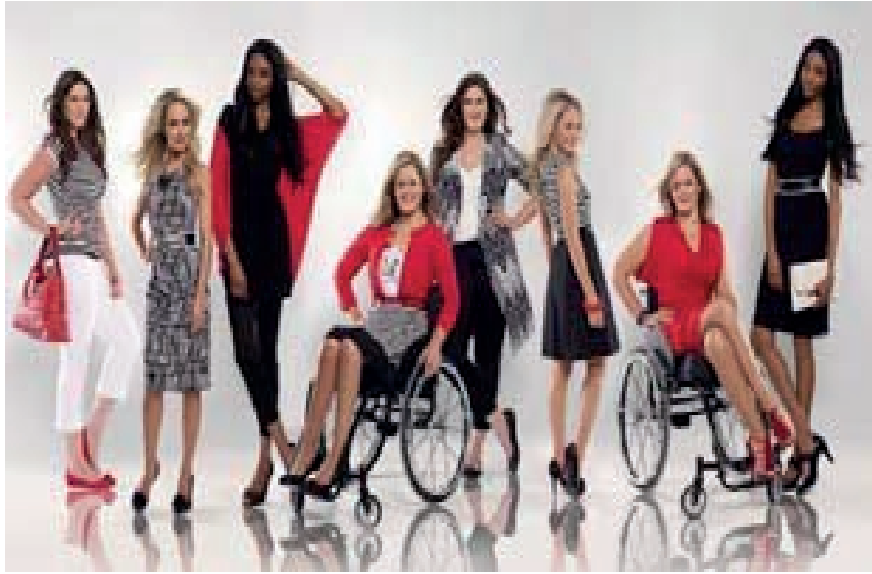
Figura 3. Campaña de publicidad de la marca de moda Diesel

Otra forma original de ofrecer ese «algo más» en beneficio de la sociedad lo hallamos también de forma original y magistral en la campaña de publicidad de la marca de moda Diesel. La marca coloca a sus modelos en escenarios irreales con el objetivo de llamar la atención sobre una cuestión en la que se sienten comprometidos como miembro de la sociedad, así que aprovecha la oportunidad que tiene como empresa.