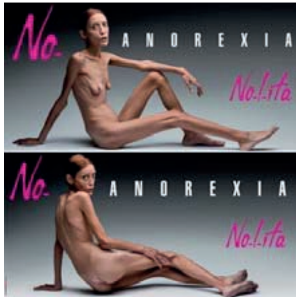
Figura 2. Moda italiana Nolita

En el año 2007 Toscani volvió a escandalizar cuando realizó la campaña para la empresa de moda italiana Nolita, advirtiendo de los perjuicios de la anorexia.