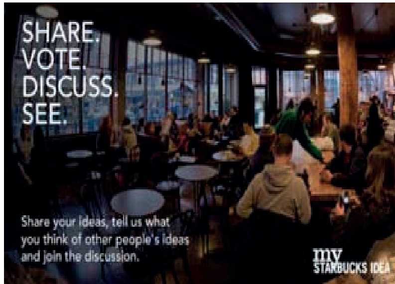
Figura 8. Good Work

Este año el festival internacional de creatividad Cannes Lions ha unido los conceptos creatividad y proyecto social. La idea se ha llamado Good Work , una propuesta destinada a unir el poder de la creatividad con la necesidad de participación en los problemas sociales. El objetivo ha sido mostrar como la creatividad, representada a nivel global en este certamen, es capaz de realizar eficaces trabajos que aborden temas serios que desafían a la sociedad. Publicidad que ayuda a llamar la atención sobre cuestiones importantes que afectan a todos, a cambiar actitudes y a motivar nuevos comportamientos. Es una forma de demostrar que desde la creatividad y desde la publicidad se pueden abordar problemas complejos y que en épocas de confusión una forma de ayudar es a través de la creatividad publicitaria.