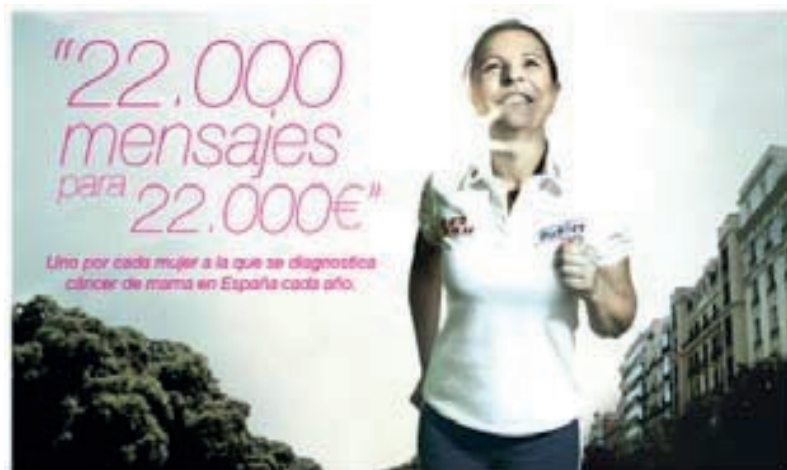
Figura 7. Starbucks

Cuando se reúnan estos 22.000 mensajes de apoyo en el buzón solidario, Buckler donará 22.000 euros en apoyo a la lucha contra el cáncer de mama, un euro por cada mujer a la que se le diagnosticará la enfermedad en España el año que viene (según datos de la ACCE). Buckler es una marca interesada en ser reconocida con valores asociados a los estilos de vida saludables.