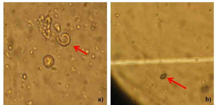
Figura 2. Dos de los efectos ejercidos por los preparados minerales sobre esporas de M. royeri . a) Degradación de la pared celular, causada por el SSC a las 48 h.; y b) Espora deshidratada, 48 h después de su exposición al tratamiento CBP.

About the mechanisms of action of mineral preparations on the pathogen, complementary to the inhibition of sporulation and mycelial formation that was observed in the agar diffusion test, during the liquid medium test it was possible to observe inhibition of spore germination and death caused by the breaking of cell walls (Figure 2a) and/or dehydration (Figure 2b). In vitro and field level have been documented the same effects on different phytopathogenic for various elements and compounds that compose the six mineral preparations: Sodium bicarbonate (Yildirim et al. , 2002), sulfur (Khan and Kulshrestha, 1991; Williams et al. , 2002; Williams and Cooper, 2004), calcium polysulfide (Montag et al. , 2005; Holb and Schnabel, 2008; Ramirez et al. , 2011a) and copper sulfate (Mills et al. , 2004; Montag et al. , 2006), among others. Moreover, it is known that some of these minerals induce resistance in plants, which can reduce the incidence and severity of damage in the field. In the case of broth silicosulfocalcico, one of its components is vegetable ash containing variable amounts of silicon the induction of resistance by this element has been extensively documented in different crops (Cherif et al. , 1994; Fauteux et al. , 2005; Qin and Tian, 2005).