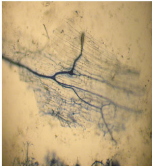
Figura 2. Hifas desarrolladas como red arbuscular.