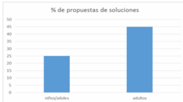
Figura 3. Porcentaje de respuestas con propuestas de soluciones en ambos estratos de la comunidad El Pitirre.

evidenciaron bajo perfil de propuestas, pues ninguno de los casos superó el 50% del total para decidirse a proponer posibles soluciones; fue más crítica la situación en el caso del grupo de menor edad, lo cual es paradójico, pues contrasta con otros resultados en que los niños parecen estar más involucrados; en este caso de una evidente comunidad aislada, no fue así ( Figura 3 ).