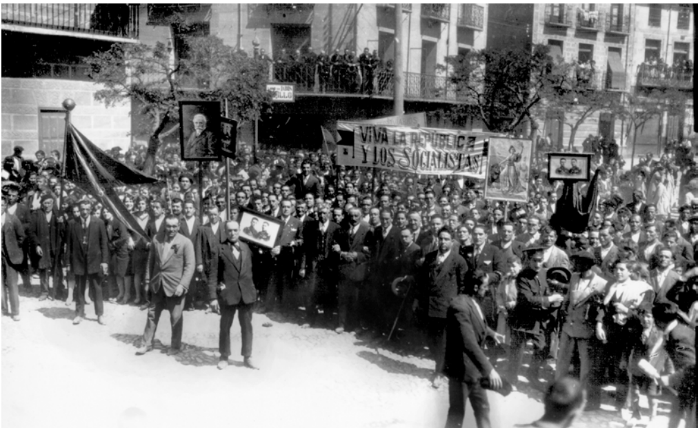
Calahorra en la calle.

El 15 de abril de 1931, “una manifestación grandiosa” que sale del paseo de Canalejas llega al Ayuntamiento. Las fotografías de Bella dan fe del entusiasmo desplegado entre banderas republicanas y socialistas, retratos de Pablo Iglesias o de los capitanes Galán y García Hernández. Los periódicos de esos días, así como las actas municipales, nos hablan también del entusiasmo y hasta de la emoción con la que se recibe el nuevo régimen de “democracia y libertad”.