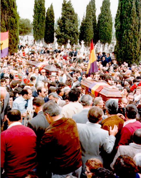
Entierro, funeral y monumento.