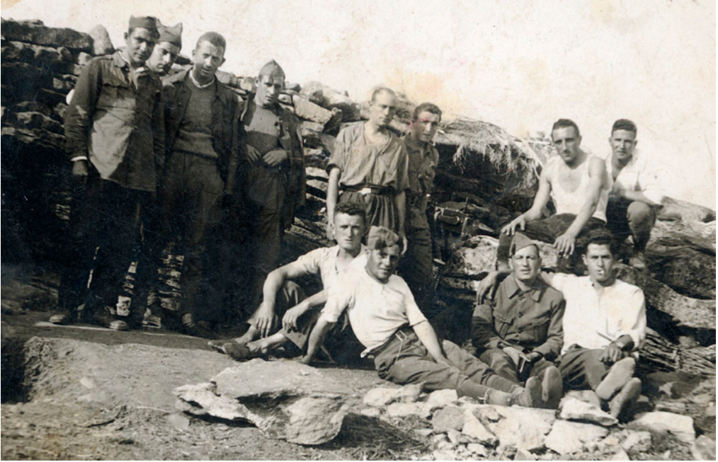
Soldados calagurritanos pertenecientes al 5º regimiento de Bailén, en la zona de Teruel.