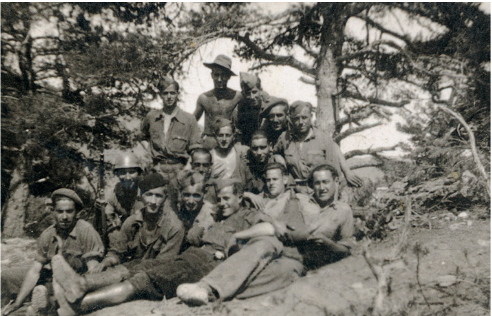
Soldados calagurritanos pertenecientes al 5º regimiento de Bailén, en los Pirineos leridanos.