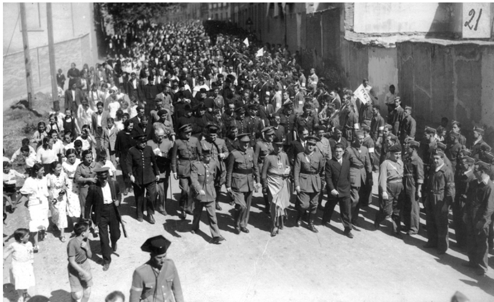
Autoridades y “fuerzas vivas” de Calahorra en la Mediavilla, hacia la catedral.