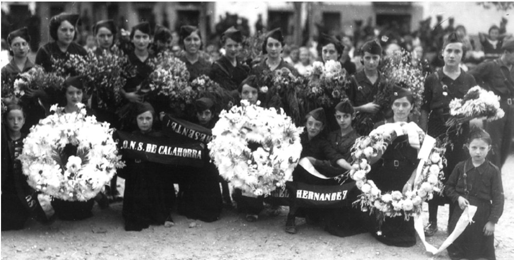
Entierro de Ángel Hernández.