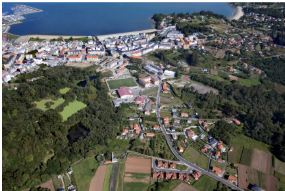
Vistas aéreas de Sada. Na de abaixo, o tesouro ecolóxico das BRAÑAS.

Xa en «Sada Dabaixo» podemos seguir á esquerda polo centro da vila, ver a capela de San Roque (santo peregrino), hoxe municipal, facer unha pequena pausa, disfrutar da gastronomía local, visitar a famosa Terraza ou ir á praia.