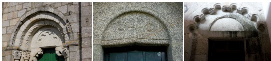
Porta principal, porta norte e porta sur que dá ó mosteiro.