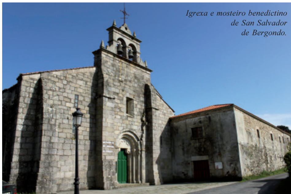
Igrexa e mosteiro beneditino de San Salvador de Bergondo.