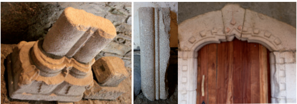
Basa e columnas pareadas do claustro do mosteiro, construído por Fernán Pérez de Andrade na segunda metade do s. XIV. E porta gótica (s. XV) do mosteiro.