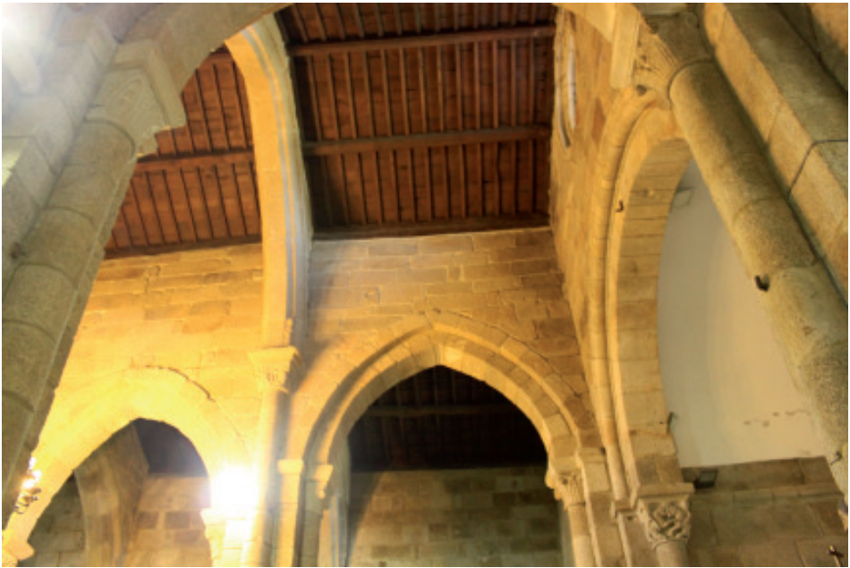
Interior da igrexa de San Salvador de Bergondo.