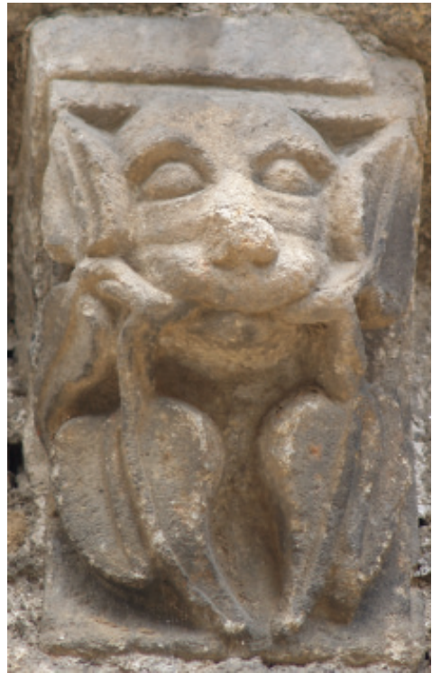
Green men ou homes verdes, positivos e negativos, na igrexa de San Francisco.