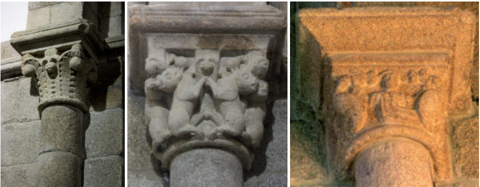
Dous capiteis románicos (s. XII) e un gótico da época de Fernán Pérez de Andrade (s. XIV).