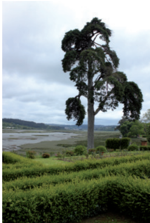
As marismas da Ría de Betanzos vistas desde os xardíns do Pazo de Mariñán cara a Betanzos.