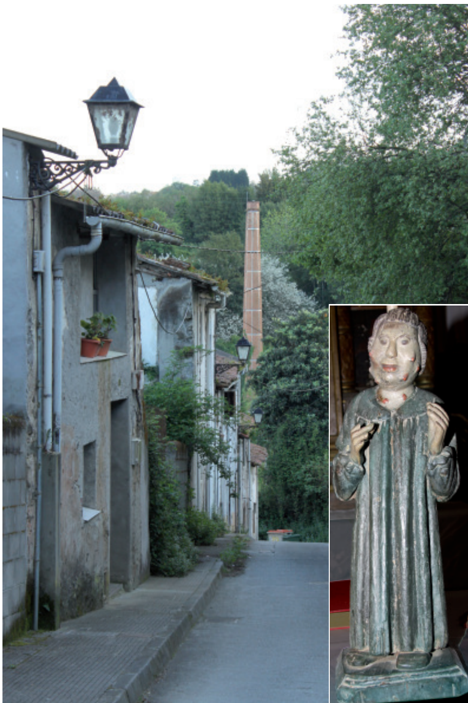
Pasamos por diante das «casetas» do antigo Hospital de Lazarados. Aínda hoxe se venera ó apestado San Lázaro na capela do barrio.