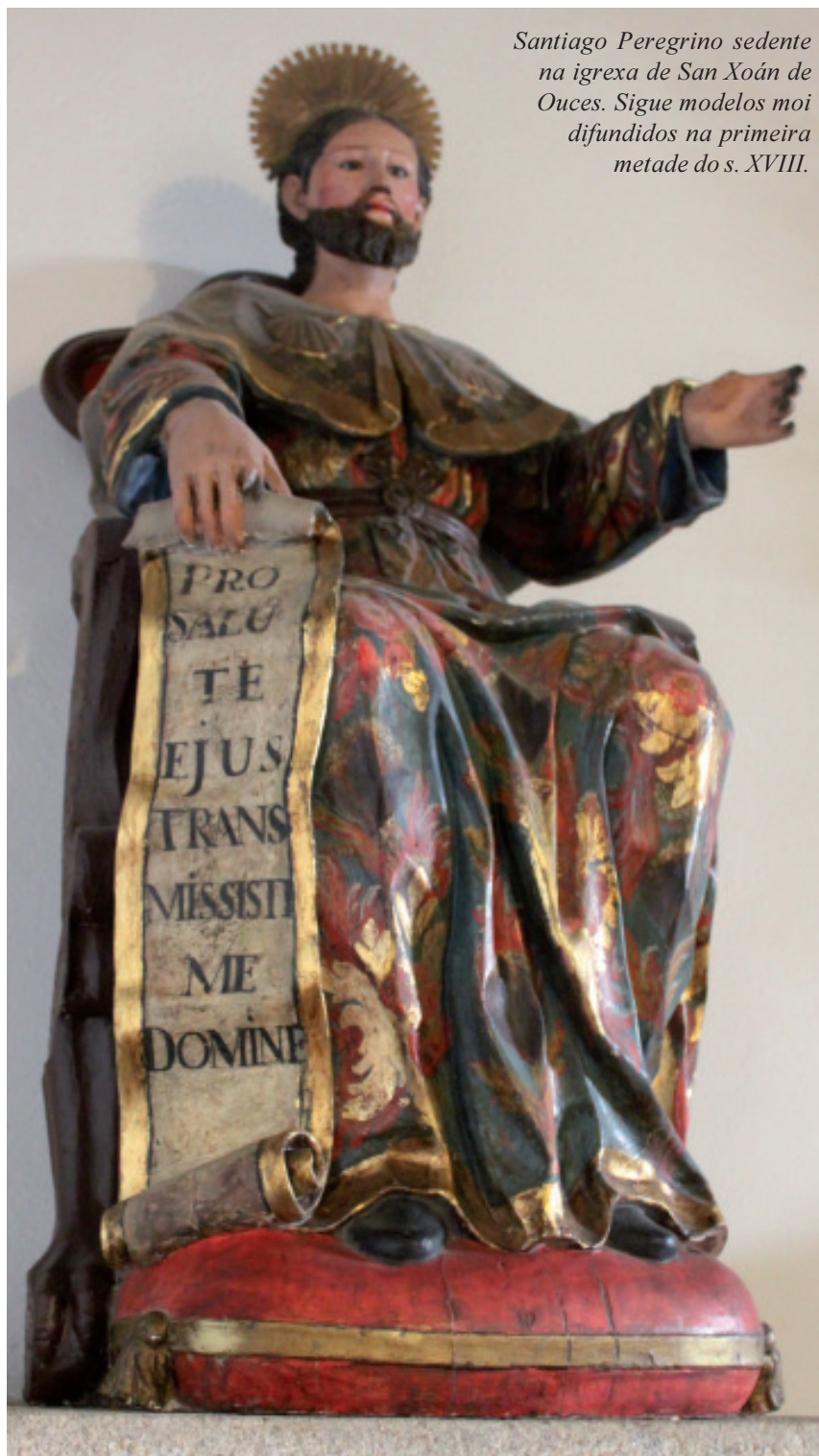
Santiago Peregrino sedente na igrexa de San Xoán de Ouces. Sigue modelos moi difundidos na primeira metade do s. XVIII.