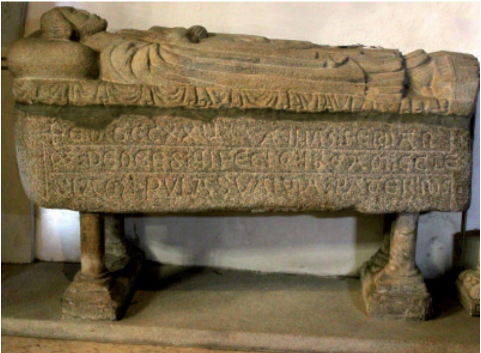
Sepulcro monumental do crego Fernán Pérez de Ouces (1287).

Detalles do exterior da igrexa de San Xoán de Ouces. Ese e outros bancos de pedra que alí hai recórdannos o lateral de laudas sepulcrais de Betanzos, Monfero e Sobrado da primeira metade do s. XV. ¿De onde proceden?