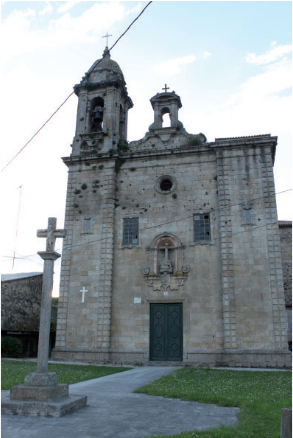
Santuario neobarroco da Quinta Angustia en Illobre (San Pedro das Viñas, Betanzos).