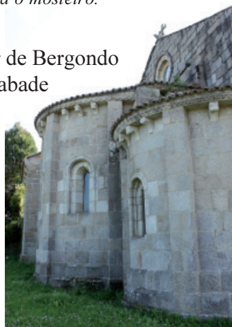
Capelas absidais románicas (s. XII) con rosetón e cruz sobre o porco bravo da reforma de Fernán Pérez de Andrade (s. XIV).

A igrexa e mosteiro abacial de San Salvador de Bergondo ( Burgundium ) xa existía en 1138, cando rexía o abade Recendus. Alfonso X é o seu protector desde 1256. No 1328 arde o mosteiro e destrúese parte da igrexa. No 1370 o conxunto pasa a formar parte da xurisdición de Betanzos. No 1380 Juan I ordena a Fernán Pérez de Andrade que libere o couto do mosteiro; sen embargo, por esas datas, Andrade reconstruíu os edificios, como se demostra na igrexa (algúns capiteis e arcos característicos, similares os das igrexas góticas de Betanzos) e no mosteiro que, a xulgar por unha basa que alí se conserva e por restos de columnas pareadas, tivo un claustro similar ó de San Francisco de Betanzos. Falta saber onde están as demais basas e capiteis.