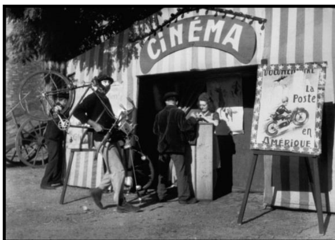
Jour de Fête , de Jacques Tati