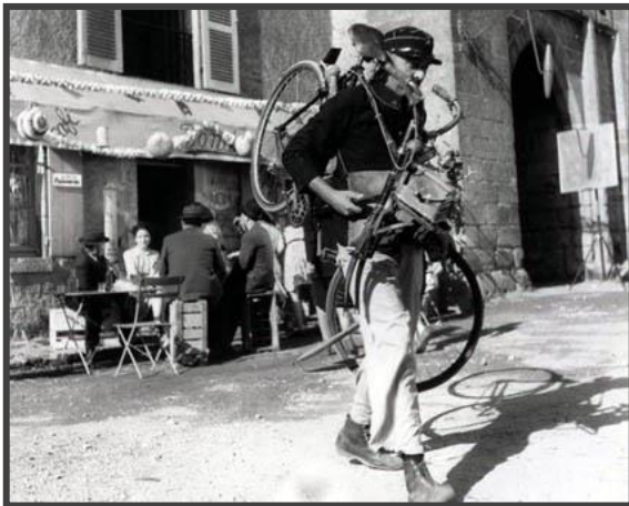
Jour de Fête , de Jacques Tati

No filme Jour de Fête é retratada uma pequena aldeia de Sainte-Sévère-sur-Indre onde, durante a festa anual, o carteiro François é vítima de uma partida. Depois de embriagado, é incitado pelos habitantes a ver um documentário sobre os métodos revolucionários de distribuição de correio nos Estados Unidos, métodos estes que ele acaba por tentar aplicar a partir do dia seguinte. Assim, são inúmeros os momentos do filme em que a identidade tradicional francesa se depara com o processo de globalização, como por exemplo, a sátira à velocidade exigida pelo mundo moderno aparece na coexistência da bicicleta com os automóveis norte-americanos.