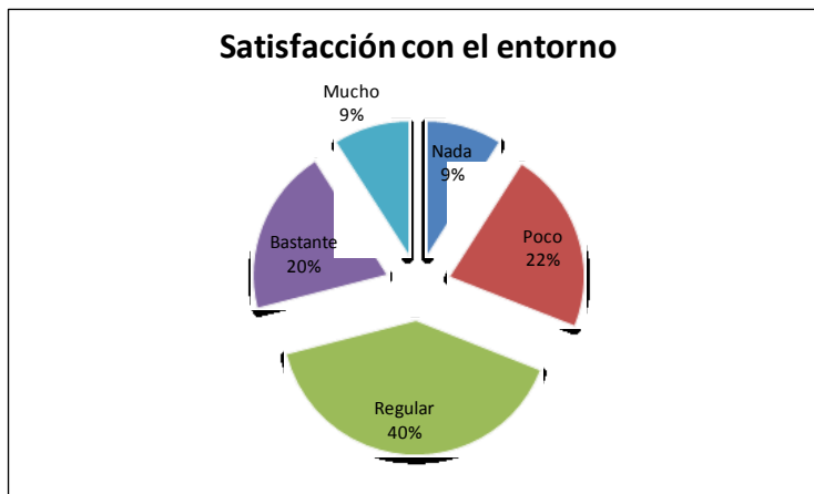
Gráfica 1. Satisfacción con el entorno.