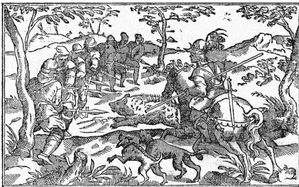
Libro de la Montería de Alfonso XI , edición de Gonzalo Argote de Molina

El anónimo Tratado de la Montería del siglo XV describe también los perros de montería y el cuidado que requieren, así como los mestizajes de razas de perros de caza. De los alanos destaca entre sus cualidades “ser ventores, porquel alano tiene el mas cierto viento de todos los canes, y por esto los que traen parte desta línea son muy buenos canes, pero turan poco en el oficio que asayan a tomar e luego son muertos” 7 . Su valentía ante animales peligrosos, como el oso y el jabalí, les costaba con frecuencia la vida.