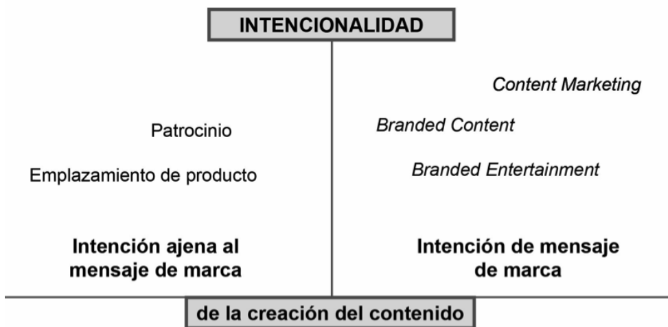
Figura 1: Clasificación según la intencionalidad del contenido

Nuestra siguiente propuesta es que el branded entertainment (y su sinónimo advertainment ) y el content marketing son dos sub-formas de branded content .