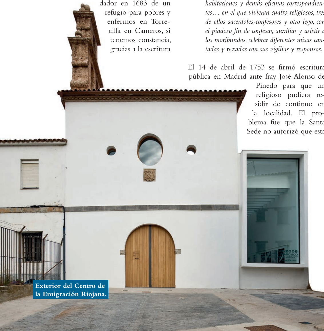
Exterior del Centro de la Emigración Riojana.