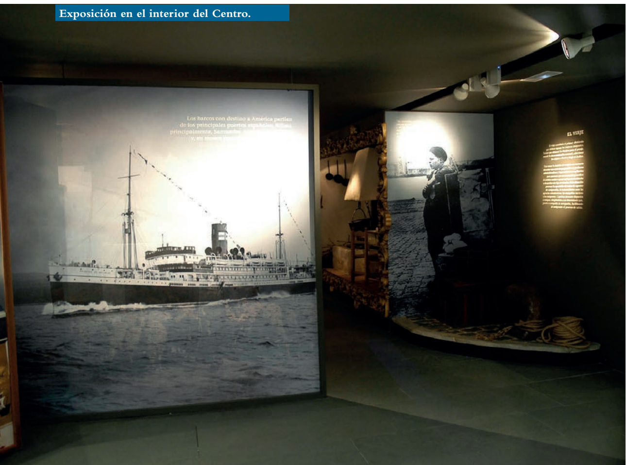
Exposición en el interior del Centro.

Desde este momento el edificio comenzó a sufrir una degradación importante. Tendremos que esperar a la segunda mitad del siglo XX para que el espacio vuelva a estar en uso: primero como cine local, tristemente recordado por un accidente ocurrido en el mismo, y luego como cooperativa, organizada por los vecinos de Torrecilla en Cameros ante el traslado de la fábrica de Pascual Salcedo a Viana.