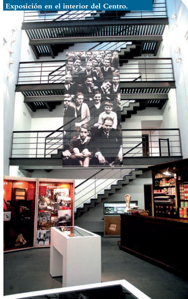
Exposición en el interior del Centro.

de rehabilitación de un edificio singular, no solo en lo referente a sus componentes histórico-artísticos sino también en su uso como espacio de divulgación y homenaje hacia los emigrantes riojanos en América.