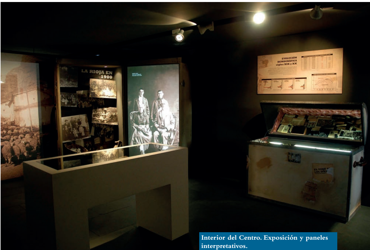
Interior del Centro. Exposición y paneles interpretativos.

persona pudiera establecerse fuera de su propio convento. Superado este contratiempo se consiguieron cumplir todos los requisitos necesarios y la primera piedra se colocó el 10 de abril de 1758. Durante la construcción, la cantidad de ocasiones en las que aparece José de Abós como testigo de acuerdos importantes nos hace pensar en él como maestro de obras. La construcción se terminó en 1759; no obstante, al poco tiempo se acometió una reforma que transformó el pequeño complejo conventual en un convento mayor con una capacidad máxima de 12 religiosos.